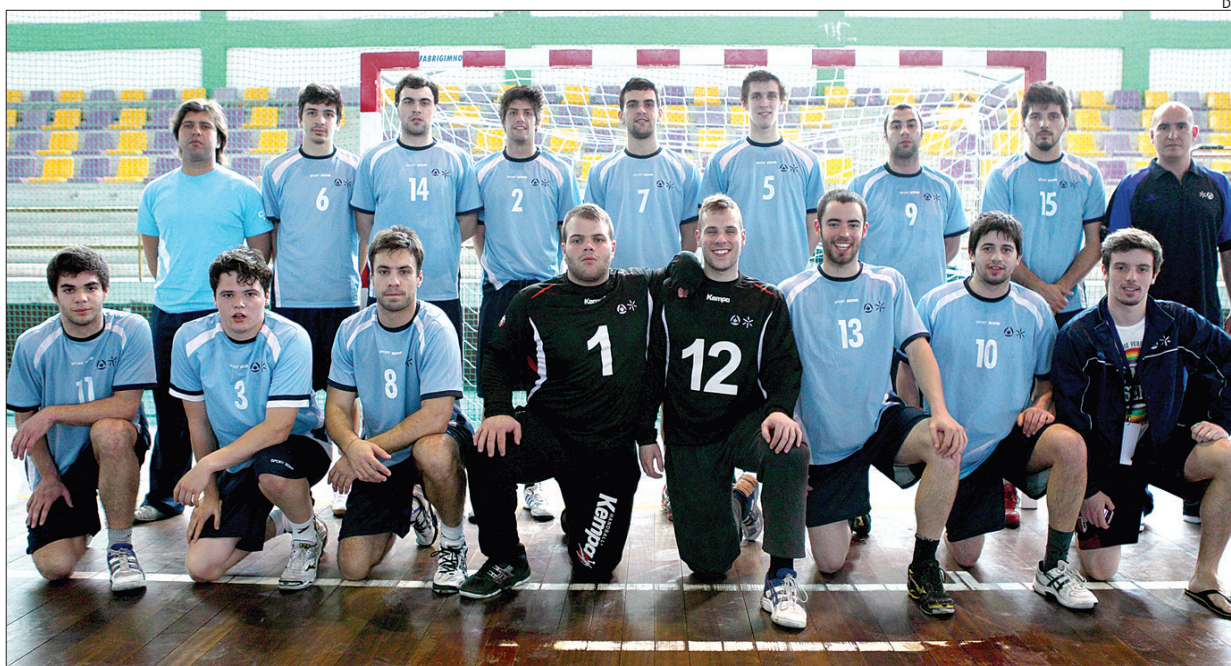
Equipa de andebol da Universidade do Minho

As equipas de andebol e futsal masculino da Universidade do Minho garantiram a presença nas meias-finais dos respectivos campeonatos da Europa, ao baterem respectivamente as suas congéneres de Leipzig (Alemanha) e Walbrzych (Polónia) por 39-33 e 5-4.