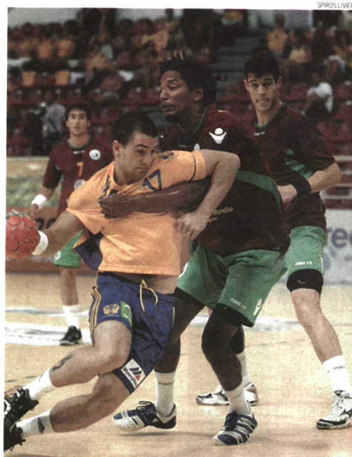
Selecção controlou o jogo que acabaria por vencer

Ontem, porém, foi a Selecção Nacional quem segurou o segun-