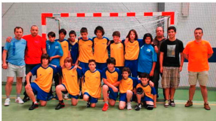
Final da Taça Queijas x Amadora Infantis.