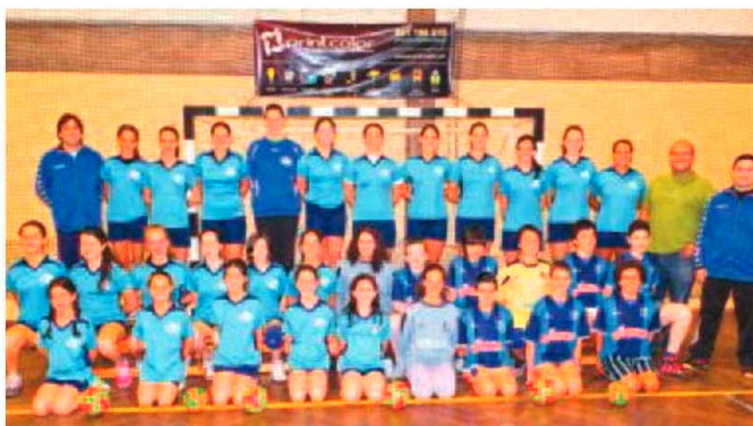
A delegação da Camacha está a protagonizar bons resultados na Maia.