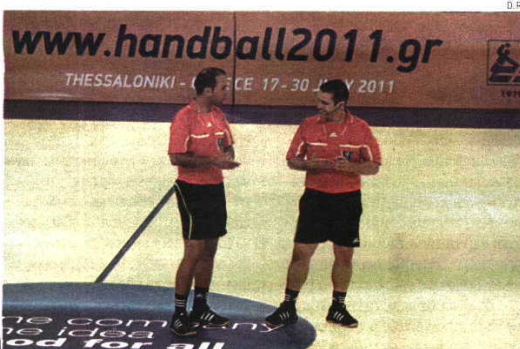
Créditos de Eurico Nicolau e Ivan Caçador reconhecidos com a chamada a jogos difíceis

Esta dupla internacional, junta há 11 anos, tem dado, na Grécia, provas de que o seu talento tem tudo para saltar fronteiras.