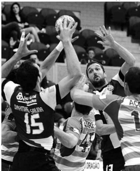
Faialenses encontram o campeão nacional FC Porto a 28 de setembro