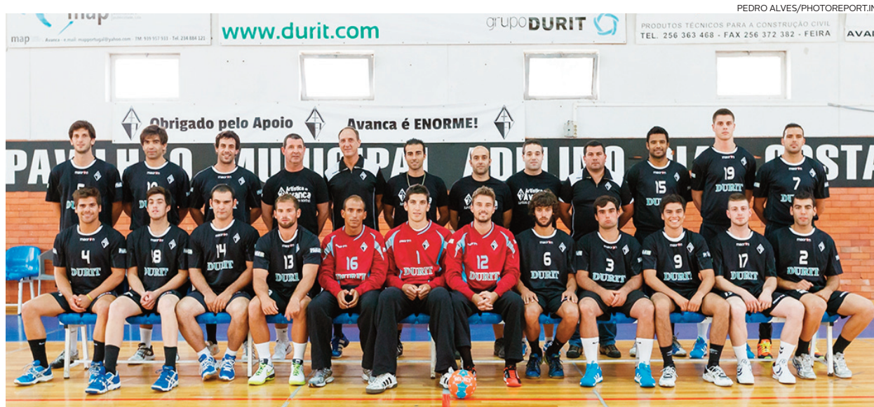
Artística de Avanca caminha a passos largos para a melhor forma

Andebol A participação equipa sénior masculina avancanense no torneio do clube nortenho saldou-se em duas vitórias e uma derrota