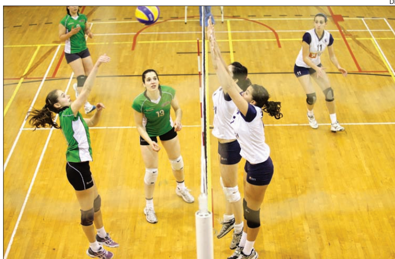
Voleibol feminino da AAUM em ação

No andebol masculino as coisas já começam a ficar mais definidas e já foram encontradas as equipas que