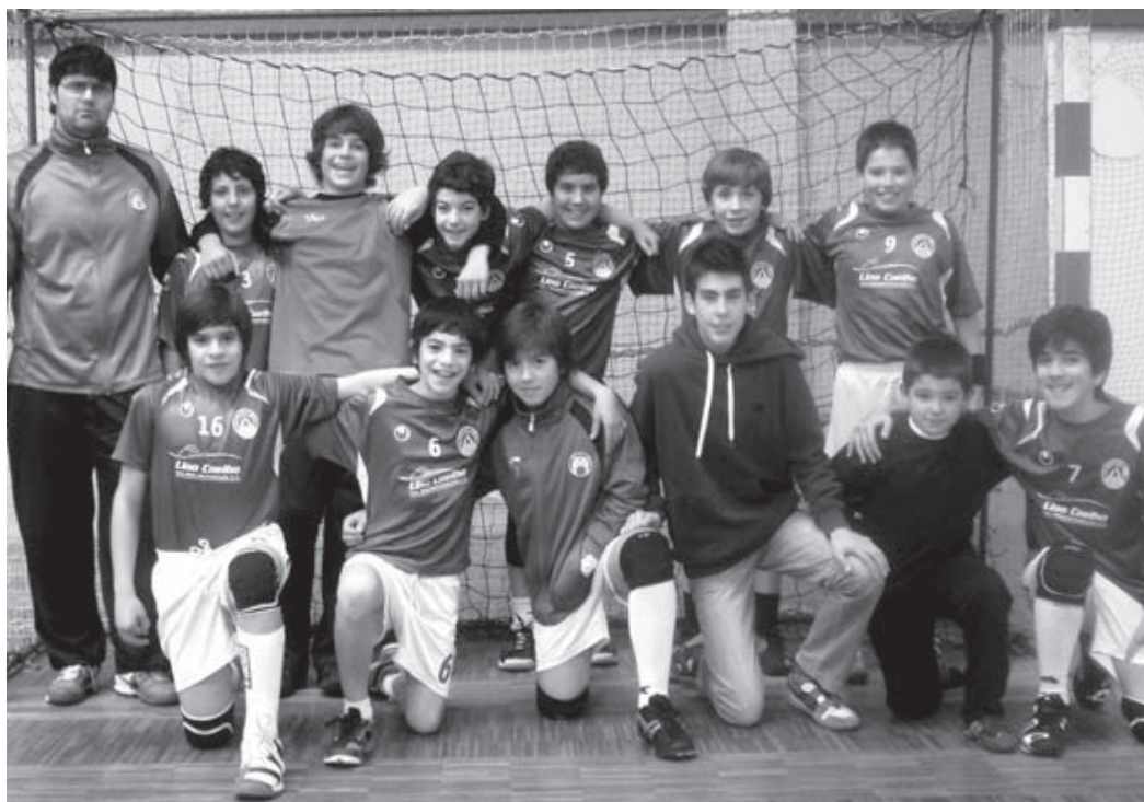
Iniciados masculinos da AAC