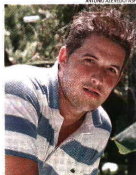
«Guardo boas recordações de Braga»

regava as bolas» de Carlos Ferreira. «Um dos principais problemas do Sporting é não ter pavilhão próprio. Para os adversários é como se jogassem em campo neutro. Lembro-me bem daquele ambiente da Nave de Alvalade, antes e durante o jogo, da mística do balneário. Acredito que o Sporting com pa-