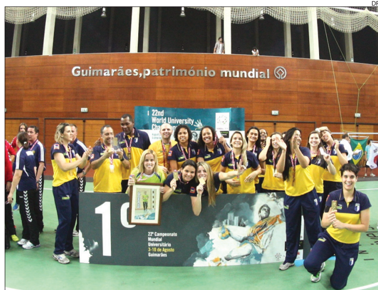
Brasil foi o vencedor no setor feminino

TURMA LUSA BATEU, NO MULTIUSOS DE GUIMARÃES, A SUA CONGÉNERE DO BRASIL