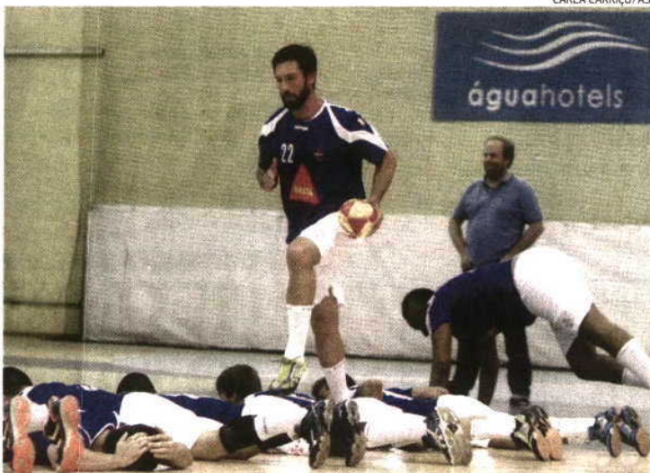
Internacional João Pinto é um dos reforços da equipa do Belenenses para a nova época