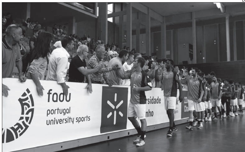
Seleção nacional masculina cumprimenta o público

A seleção portuguesa de andebol masculino joga hoje com a brasileira, a final do campeonato mundial da modalidade, que está a decorrer em Guimarães. No feminino, a final será entre a Rússia e o Brasil.