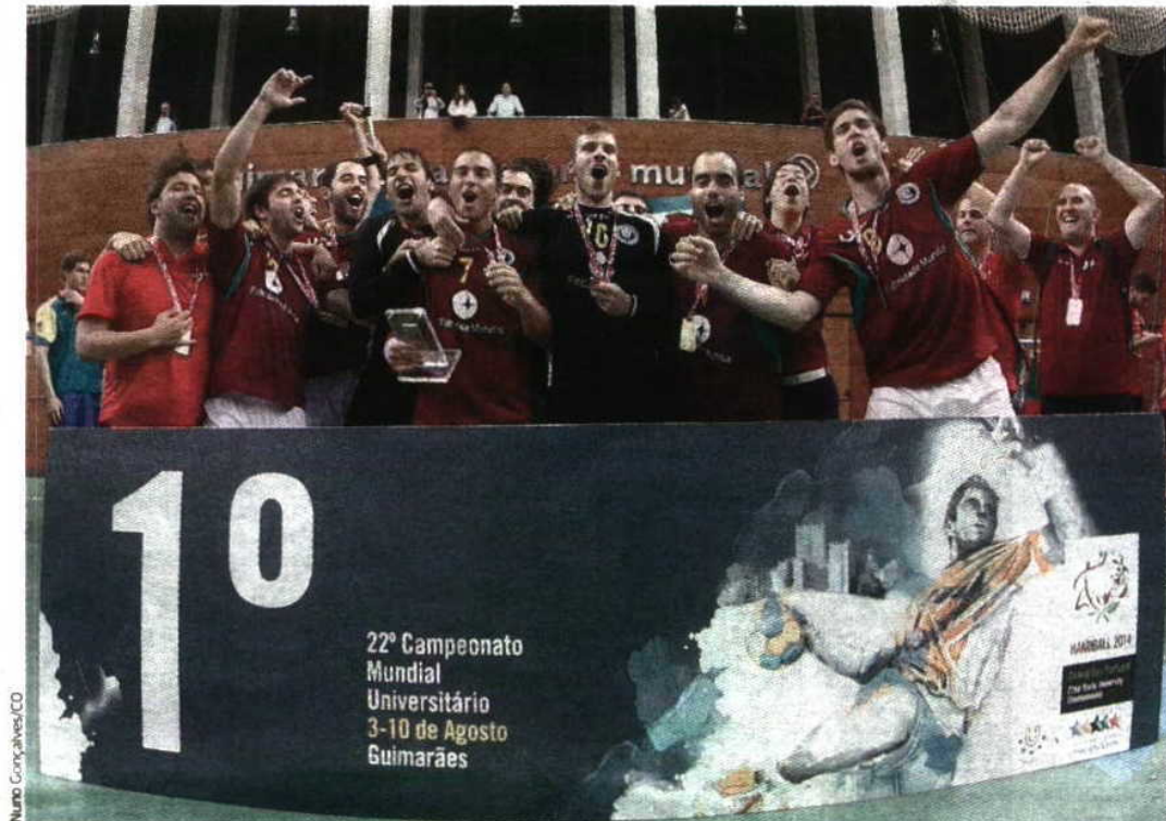
Portugal sagrou-se campeão do mundo de andebol universitário

No duelo com a equipa canarina houve sempre muito equilíbrio e, ao intervalo, a vantagem portuguesa era apenas de dois golos (14-12). Na segunda parte, Portugal começou por descolar no marcador (17-13), mas ainda se viu em situação de empate, ao so-