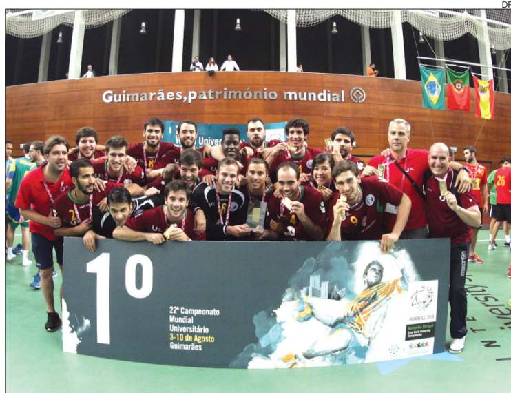
Equipa portuguesa é a nova campeã do Mundo em andebol universitário