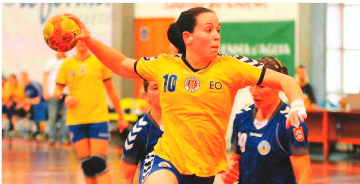
Está assegurada a continuidade de uma das atletas mais valiosas do projecto do andebol feminino madeirense.