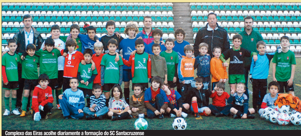
Complexo das Eiras acolhe diariamente a formação do SC Santacruzense

Escolinhas (petizes, benjamins, traquinas) são o início do "edifício" formativo futebolístico do SC Santacruzense que também tem "bola" nos seniores e veteranos. O clube atravessa um período economicamente desfavorável e que já obrigou a reduzir "a metade" o número de atletas e técnicos. Nada, contudo, que impeça o clube de continuar a apostar na formação de atletas e cidadãos.