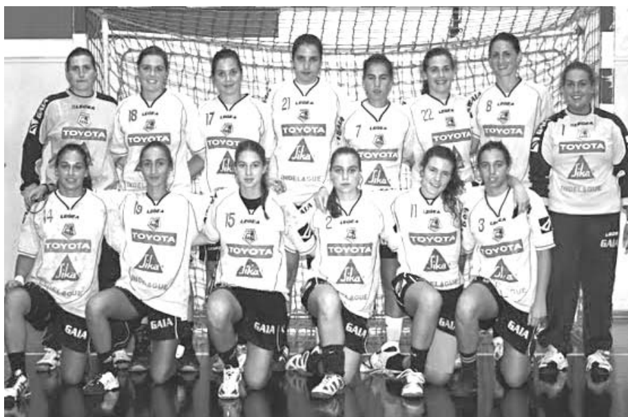
Plantel do Colégio de Gaia