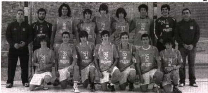
Juvenis Masculinos do Dom Fuas seguem na frente