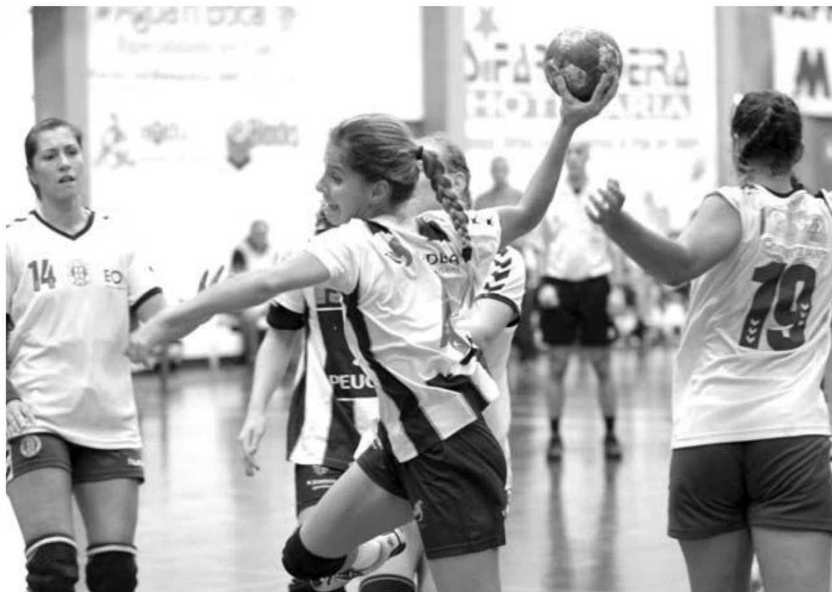
Equipas madeirenses dominam a zona 1 da I Divisão de andebol