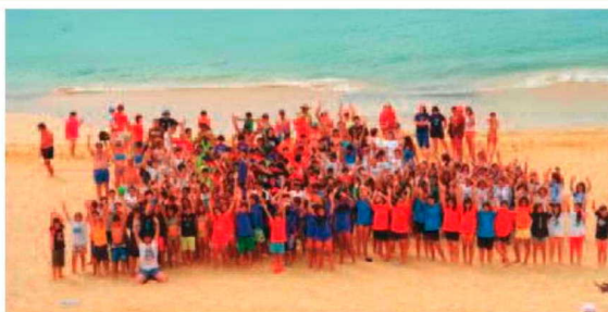
Foto Família demonstra bem do enorme convívio entre atletas, treinadores, dirigentes, árbitros e pais dos jogadores que foi feito ao longo dos três dias de competição. No final a grande vitória foi entregue ao andebol madeirense.

Em grande estilo é o que se pode assistir nos jogos de andebol de praia. Num campo reduzido e sem poder bater com a bola no chão, os pequenos craques quiseram fazer das suas, demonstrando alguns dotes de artistas. Uma situação que demonstra que mesmo na 'tenra idade' já é possível mostrar bons recortes técnicos por parte dos jogadores.