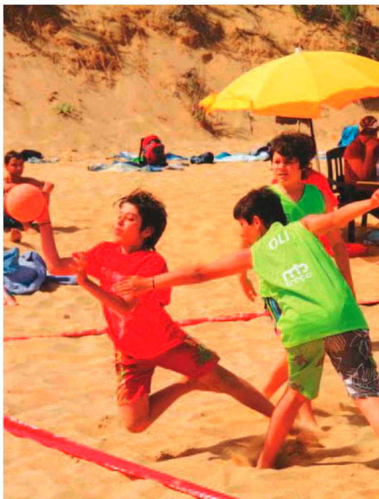
80 jogos marcaram edição de 2011 do Torneio de Porto Santo.

Já para o final desta semana a AAM tem agendado o seu jantar de final de época, onde servirá para homenagear alguém ou alguma instituição que se destacou ao longo da época. Um 'prémio' surpresa que só será conhecido por altura do convívio e que pode muito bem ser entregue a um atleta, treinador, dirigente, árbitro, ou algum clube filiado. Resta agora esperar para ser conhecido o 'homenageado' de 2011.