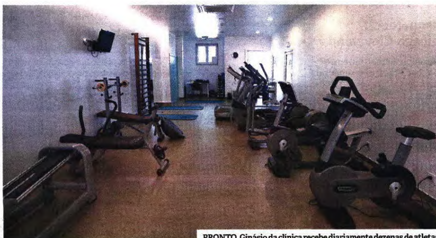
PRONTO. Ginásio da clínica recebe diariamente dezenas de atletas