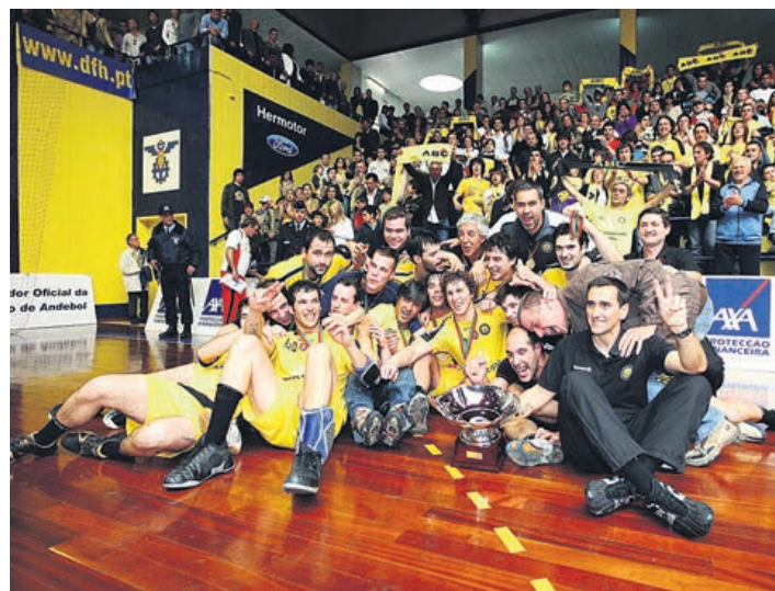
Xico Andebol estreou-se a vencer a Taça de Portugal, em 2009/10, ao bater na final o Sporting