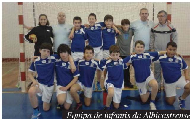
Equipa de infantis da Albicastrense