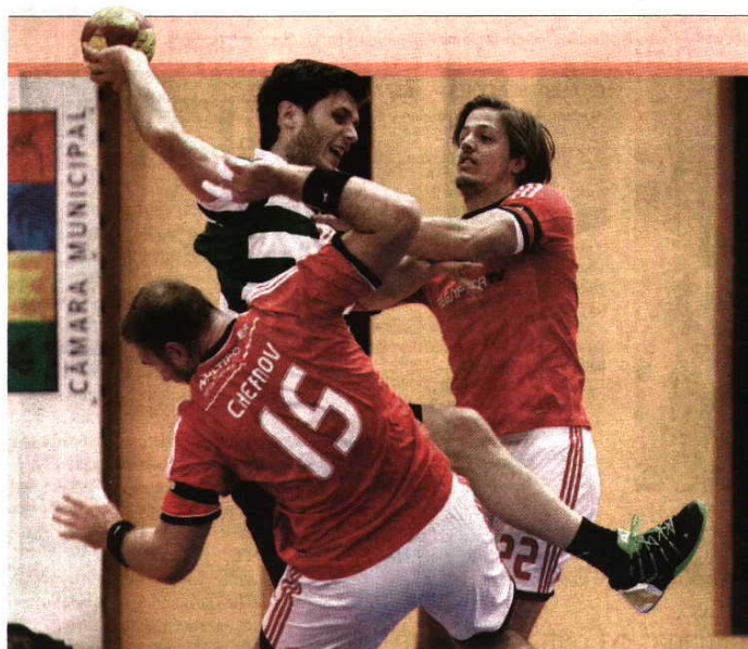
Sporting, que defende o troféu ganho nas duas últimas edições, Benfica, ABC e Xico Andebol vão lutar pela vitória na segunda mais importante prova do calendário nacional