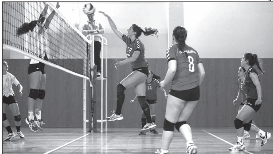
Voleibol feminino em competição

Quem também venceu no feminino e masculino foi o futsal, respetivamente por 3-2 (AEIST) e 7-3