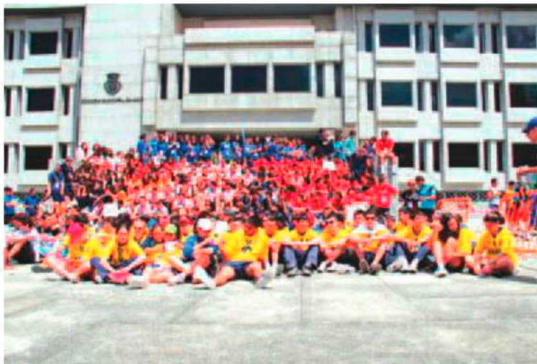
Quatro clubes madeirenses estão a competir no torneio internacional.