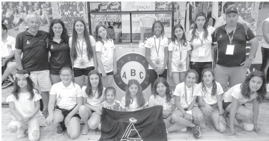
▲ Infantis da LAAC

Na fase de apuramento do 17.º ao 24º lugares a equipa derrotou consecutivamente o ABC por 20-8 e a Juventude do Mar por 27-18, mostrando o seu