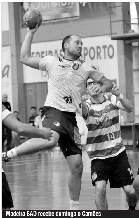
Madeira SAD recebe domingo o Camões

Arrancou já a disputa da 6.ª jornada da liga portuguesa de andebol masculino, com o Benfica a vencer o dérbi de Lisboa, ganhando ao Sporting, por 28-22, em Alvalade.