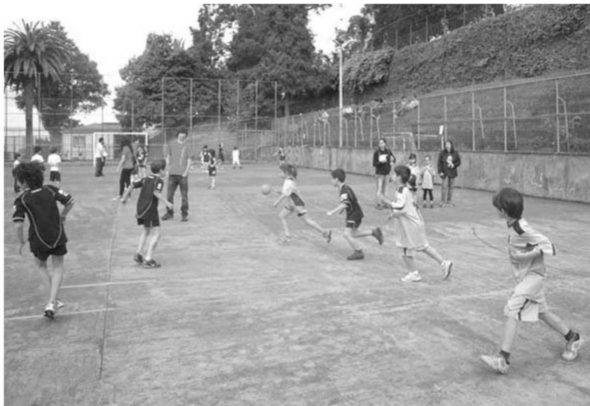
Colégio do Infante recebeu evento destinado ao escalão de bambis.

Numa organização do CD infante, foram mais de uma centena de crianças, distribuídas por 15 equipas de vários clubes regionais que tiveram uma manhã memorável, onde para além de poderem demonstrar os seus dotes de jogadores, tiveram a oportunidade de experimentar outras ac-