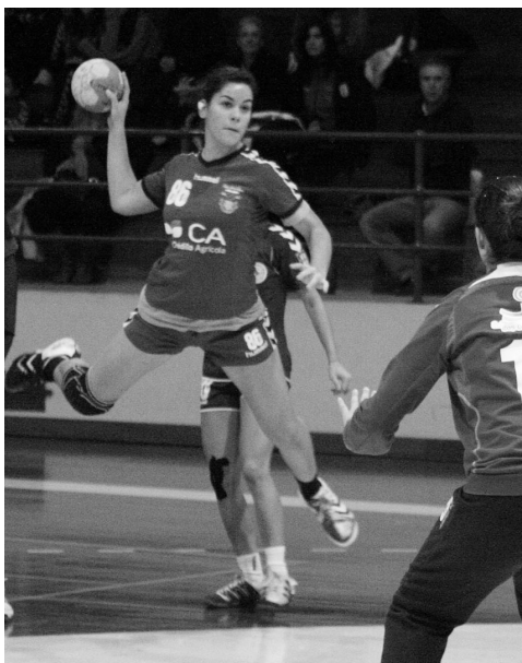
COLÉGIO chegou a estar à frente do marcador mas não evitou derrota

Pensou-se que o jogo poderia ficar decidido, mas foi puro