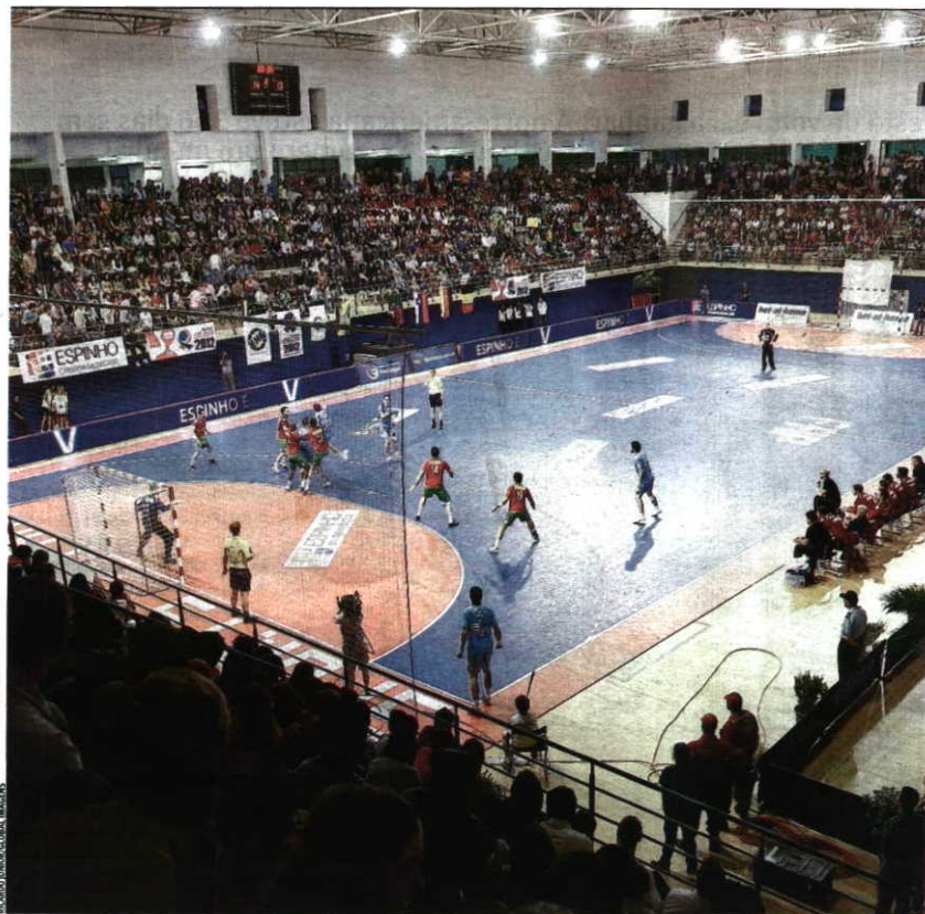
Seleção Nacional A partir de 2013 espera-se que jogue nos grandes palcos