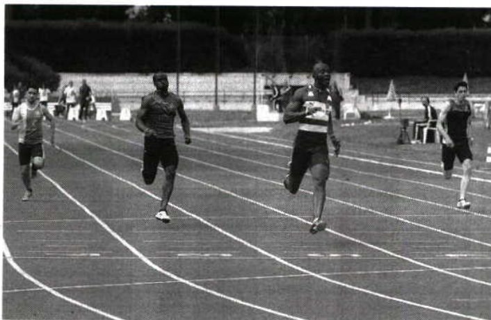
Estádio acolhe mais de mil treinos e 900 jogos anuais, em diversas modalidades

Em causa está uma cativação de quase 600 mil euros que, pela primeira vez, o Governo fez às re-