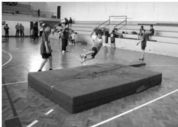
Circuito de habilidades encantou os cerca de 100 atletas.