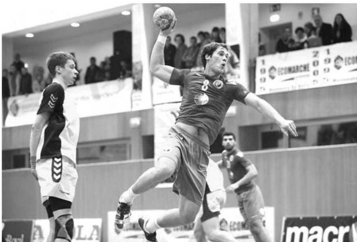
Jogador do Benfica foi uma das apostas da selecção nacional A nos últimos jogos da qualificação europeia.