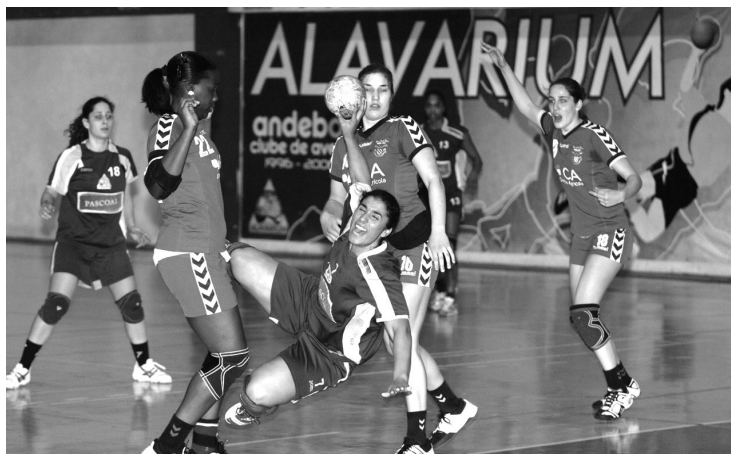
SENIORES FEMININOS do Alavarium fazem história no andebol