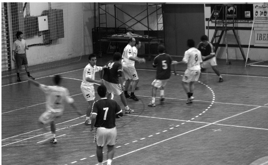
O Académico de Viseu foi a melhor equipa da região na 3.ª Divisão Nacional

Não se pode dizer que tenha sido uma campanha positiva, pois o Académico de Viseu falhou a fase de apuramento para a subida, apesar de ser considerada a melhor equipa da zona a