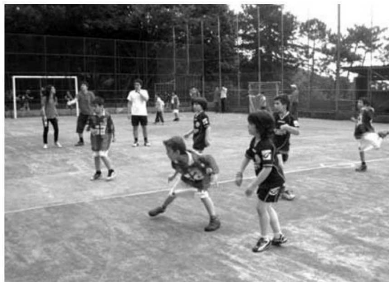
Marítimo e Académico foram alguns dos clubes presentes na festa.