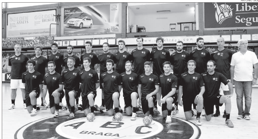
ABC não teve dificuldades para levar de vencida o Sporting da Horta

ABC/UMINHO COM VITÓRIA TRANQUILA ESPERA RESULTADO DO PORTO-BENFICA