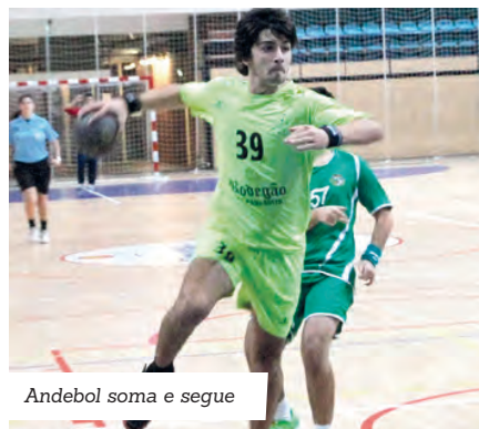
Andebol soma e segue

A coletividade da Póvoa de Varzim venceu os seus três jogos do passado fim de semana. Na categoria de juniores, a equipa poveira derrotou o Madalenense por 29-14, enquanto o conjunto juvenil venceu por 52-13. Ambos os jogos foram realizados no pavilhão Municipal da Póvoa. No único desafio realizado fora, os jovens que compõem a equipa de iniciados triunfaram na casa do Padrão da Légua por 19-29.