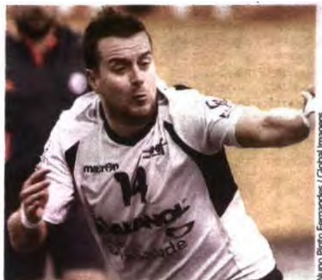
Nuno Pinto Fernandes / Global Images