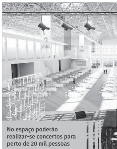
No espaço poderão realizar-se concertos para perto de 20 mil pessoas

CO – Este é um espaço polivalente e plural que permitirá a realização de congressos e eventos empresariais, mas também a realização de espetáculos, exposições, concertos