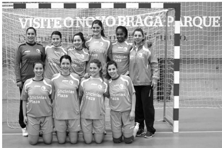
AS CAMPEãs NACIONAIS DA AAUAV vão disputar os títulos europeus de Andebol e Basquetebol

Vinte e dois atletas dos 231 portugueses que ontem começaram a disputar os “EUSA Games” são de Aveiro. Andebol e Basquetebol feminino são as modalidades em que participam as equipas aveirenses