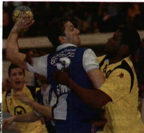
Brilhou > Spínola foi ganhar a Braga na época passada