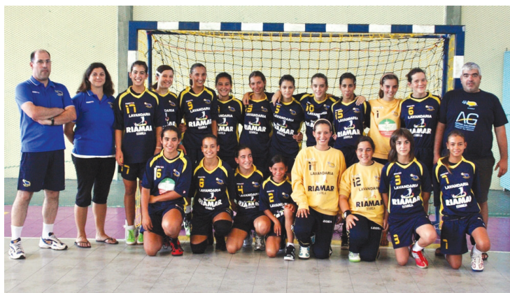
INICIADAS foram as únicas que venceram na primeira aparição da equipa