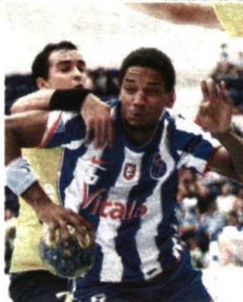
Dragões Implacáveis para com o Madeira SAD

pré-época. Animado deverá ser o Madeira SAD-Belenenses, equipas habituadas a intrometerem-se entre os grandes, enquanto a Ac. S. Mamede procura no reduto do São Bernardo uma segunda vitória consecutiva na época de estreia no campeonato Andebol 1. HUGO COSTA