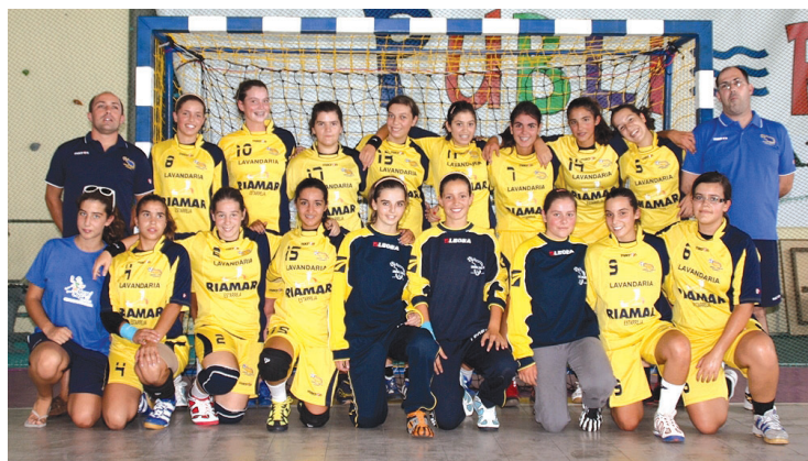
JUVENIS do Arsenal de Canelas apresentaram-se aos adeptos a perder