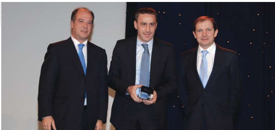
A Câmara Municipal de Cascais distinguiu Paulo Bento, selecionador nacional de futebol, pelo empenho com a equipa lusa no ano passado.

O Salão Preto e Prata foi o local escolhido para receber a maior festa do desporto de Cascais. Promovido pela Câmara Municipal, este evento reúne as coletividades, clubes, atletas e agentes desportivos do concelho que no ano transato se tenham destacado nas mais variadas competições, a título coletivo e individual. Antes do grande momento da noite, foram chamados ao palco os campeões nacionais, vencedores Taça de Portugal e de títulos internacionais divididos por clubes e/ou coletividade. No intervalo da entrega dos galardões, o público foi brindado com uma exibição de dança protagonizada por alunas da Escola Básica 2,3 Prof. António Pereira Coutinho e outra de ginástica acrobática desta vez a cargo do Grupo Dramático e Sportivo de Cascais, um dos distinguidos.