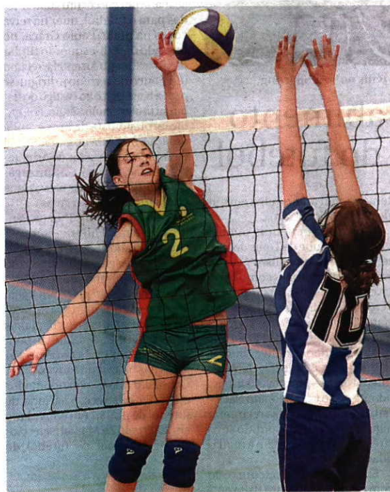
Cerca de 160 mil alunos participam nestas actividades desportivas