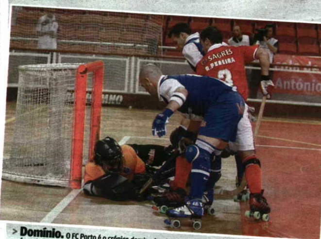
> Domínio. O FC Porto é o crónico dominador do hóquei em patins português, mas esta época o Benfica conseguiu conquistar uma Supertaça diante dos campeões nacionais