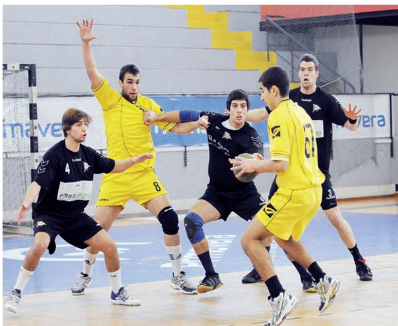
Equipa de juniores do ABC continua a lutar para o título nacional

onato dos juvenis. A competência jamais foi colocada em causa mas a inexperiência sim. Num grupo muito difícil, uma luta a quatro por duas vagas. Mas, o grande mérito desta equipa foi nunca baixar os braços. Quando as dificuldades ensombriam a fase final, os juvenis deram sempre um grito de revolta e venceram os impossíveis.