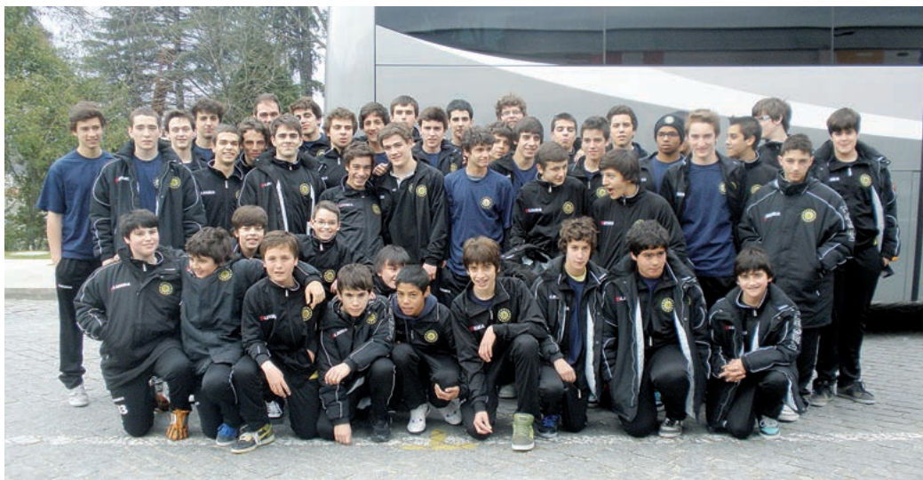
Equipas de infantis, iniciados e juvenis do ABC

Que o ABC é um clube especial, restariam poucas dúvidas, mas, por estes dias, respira-se um ar diferente para os lados do Sá Leite. A cabeça está mais erigida, os ventos sopram de Norte para Sul, e Braga continua a ser a capital do andebol. Porque onde há andebol, está lá o ABC... na linha da frente.