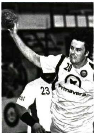
Capitão sonha com o título

No clube bracarense, antigo campeão nacional, sonha-se com o título: "Vamos lutar até não podermos mais, com muita alma e muito coração, além da qualidade que temos, para somarmos as vitórias necessárias à conquista do título. É um sonho de todos nós...", reconheceu o central, que pediu a presença massiva dos adeptos no Pavilhão Flávio Sá Leite amanhã.