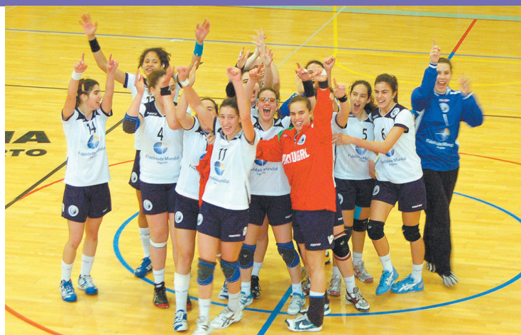
A festa da selecção portuguesa no domingo

Classificação geral - Grupo 7: 1º Rússia (6 pontos); 2º Portugal (4); 3º Montenegro (2); 4º Macedónia (0)