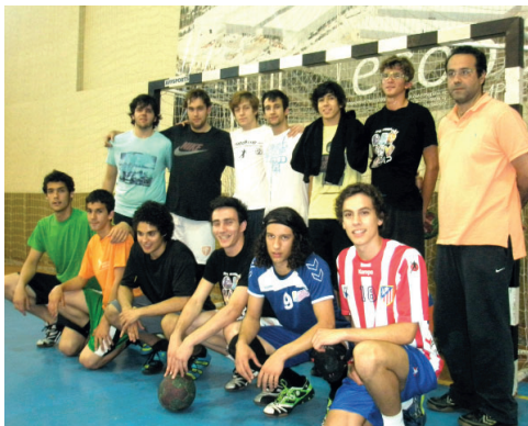
ESTARREJENSES querem vencer e festejar o apuramento em casa

ção do Estarreja nesta fase, o técnico garante que a sua equipa "está muito motivada", apesar do sentimento de tristeza que viveu aquando do jogo frente ao ABC. "Sabíamos que nos bastava um