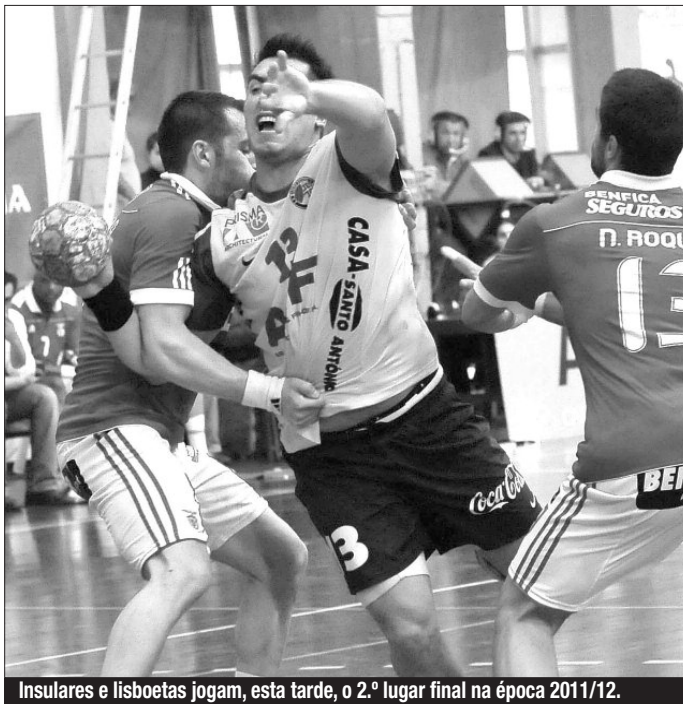
Insulares e lisboetas jogam, esta tarde, o 2.º lugar final na época 2011/12.

Jogo grande esta tarde (17h) em Lagos, no Algarve. Gil Eanes e Madeira SAD cumprem a 17.ª e penúltima jornada da fase final da 1.ª Divisão feminina, num jogo que decidirá, por certo, o título nacional desta época. No embate da 1.ª volta, as algarvias venceram no Funchal, naquela que foi a única derrota da SAD esta temporada e, hoje, quem