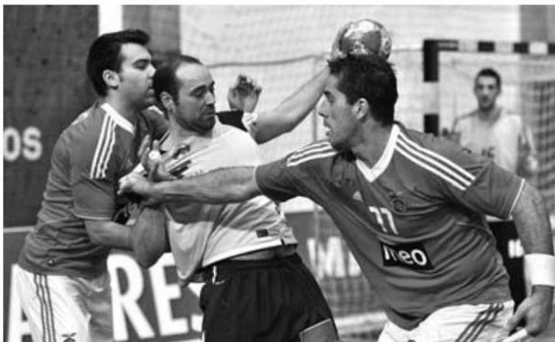
Madeira SAD recebe esta tarde o Benfica.

O técnico Paulo Fidalgo e toda a administração da SAD, ao longo da época têm vindo a gerir um plantel 'massacrado' pelas imensas dificuldades financeiras, correspondendo dentro de campo, com uma atitude e resultados louváveis. A jornada completa-se com o Porto-Sporting e ABC-Águas Santas. O Porto lidera com 56 pontos, seguido do Madeira SAD com 47 pontos. Sporting e Benfica seguem atrás com 45 pontos. Águas Santas com 41 e ABC com 40, fecham a classificação.