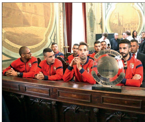
Equipa de futebol de praia do SC Braga

O SC Braga é «um clube eclético, com grandes profissionais, ao nível do melhor da Europa e do Mundo, e a comunicação social por vezes não dá a atenção devida à qualidade dos atletas que existem nestas modalidades no nosso clube e noutros. Atletas que trabalham em prol de uma camisola para conquistar títulos, como foi o caso do futebol de praia, que veio para o clube há quatro anos e tem conquistado quase tudo. É a primeira vez que um clube nacional consegue conquistar a Liga dos Campeões de futebol de praia. É um dia muito importante para o nosso clube e para a nossa cidade. Obrigado à CMB por reconhecer isso», destacou, lembrando as vitórias no fim de semana no futsal (bateu o Benfica), voleibol (sub-18 ficou em terceiro lugar) e natação (quatro medalhas de ouro e uma de prata no Meeting Internacional do Porto).