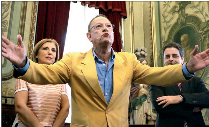
Presidente do ABC/UMinho diz que clube vai apostar «ainda mais» na formação