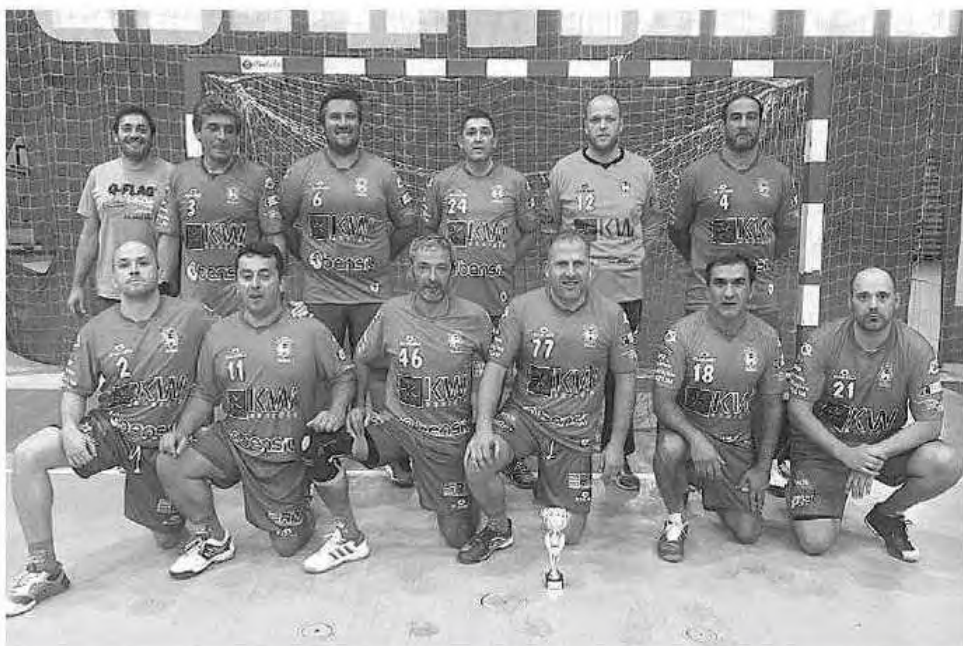
Verde-rubros têm dominado a competição regional nos últimos dois anos.

Integrados no escalão +35 anos, que conta com um total de 12 formações, os madeirenses foram colocados, na primeira fase da prova no Grupo A, juntamente com a selecção russa e as equipas do FIF (Dinamarca), Sant Quirze Veterans (Espanha), Puerto Sagunto (Espanha) e Esferantástica (Portugal).