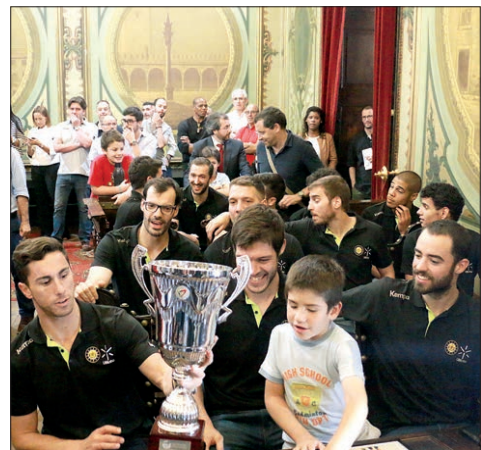
A Taça de Portugal conquistada pelo ABC/UMinho