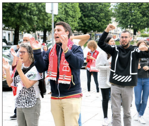
Adeptos de ambas as equipas foram à CMB