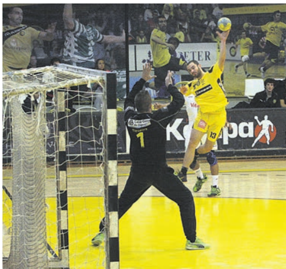
ABC/UMinho quer vitória contra os leões para se aproximar do terceiro lugar

Amanhã, os bracarense têm a primeira deslocação nesta fase