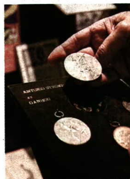
Medalha de António Stromp pela participação nos Jogos Olímpicos de Estocolmo (1912)