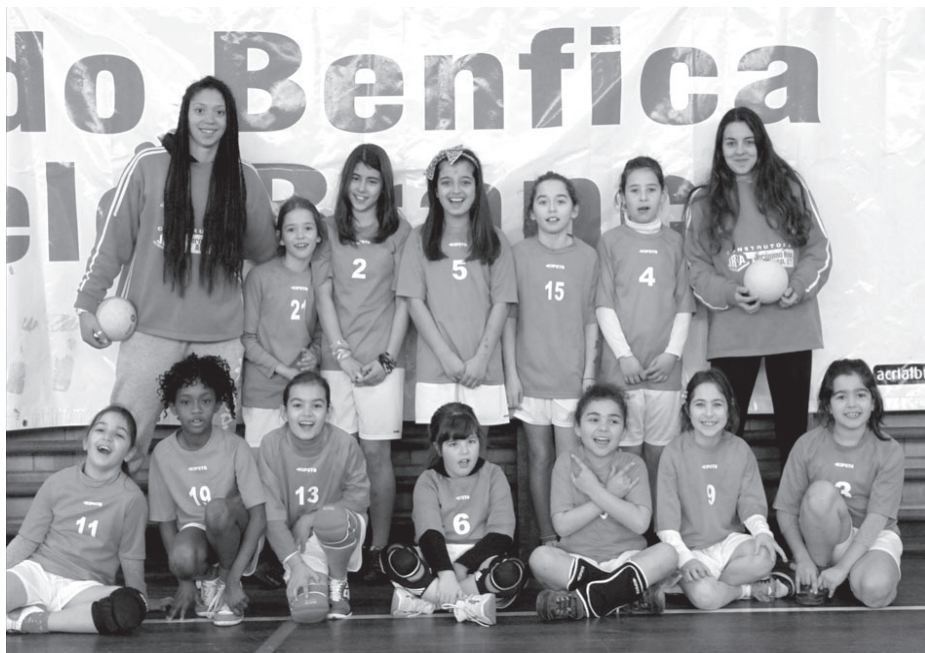
As bambis da Casa do Benfica

Contando com a presença da equipa do ADA e da Casa do Benfica do Entrocamento, num total de 75 crianças, (11 equipas) o evento dirigido aos escalões de bambis (7 e 8 anos) e Minis (9 e 10 anos), decorreu durante toda a manhã proporcionado a estes jovens a