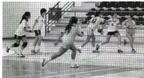
Nazaré Cup 2013 está a criar expectativas

tem sido apanágio de ano para ano, é de salientar que contamos ter em competição cerca de 1200 a 1500 atletas." De seguida Chicharro afirmou, "este ano vamos ter uma novidade, vamos lançar mais um escalão, ou seja, Juniores nesta competição, e com bastante adesão até a este momento no que diz respeito a inscrições." Para concluir o presidente da AEDFR disse que "este ano vamos ter como prato forte na já habitual Taça Amizade, um Sporting - Benfica em seniores masculinos, no dia 26 de Março pelas 20h30". ■