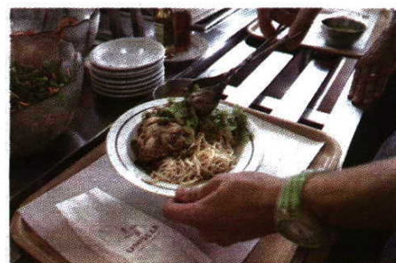
Refeições são servidas nas cantinas mesmo sem aulas