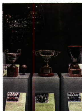
Três dos cinco títulos em provas europeias conquistados pela equipa de hóquei em patins