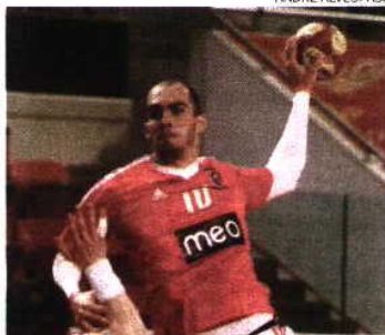
Pedroso liderou as águias com seis golos