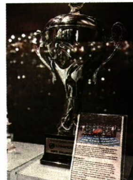
Em 2010, os leões fizeram história no andebol e venceram a tão cobiçada Taça Challenge