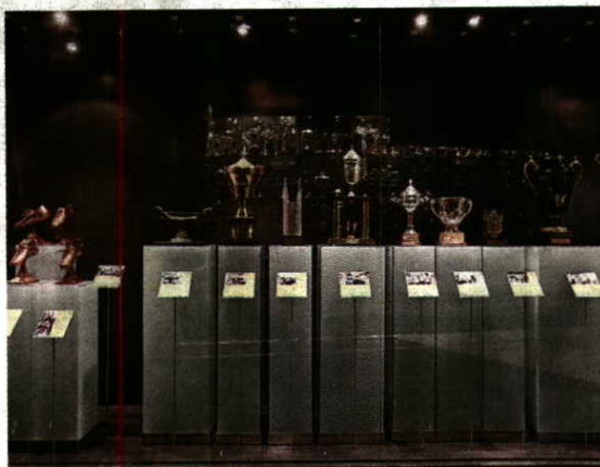
O atletismo é a modalidade por excelência do Sporting. Aos 14 títulos europeus de corta-mato o clube junta um em pista coberta