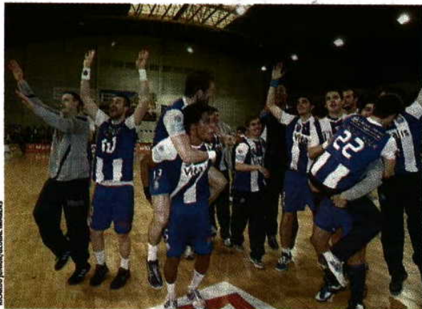
Festa ➤ Este foi o tetra portista, celebrado na Mala

Nos últimos dois anos, o FC Porto foi campeão em casa do Águas Santas, celebrando o tri (2010/11) e o tetra (2011/12) antes do final do campeonato – à sétima e à oitava jornada, respetivamente –, mas esta época não será assim. Nesta segunda ronda da fase final (20 jornadas), a equipa de Ljubomir Obradovic joga em casa dos maiatos (hoje), que ocupam a quinta e penúltima posição. Ora, o FC Porto é segundo classificado, com 35 pontos, os mesmos do líder Benfica (recebe o Horta), não