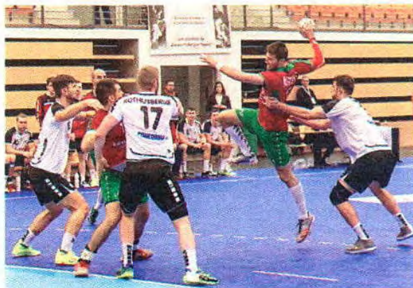
Fernando Fontes / Global Images

reira. “Sabíamos que íamos ter um adversário muito complicado, mas é sempre bom jogarmos com equipas como a França. Vai ser uma guerra entre nós, Lituânia e Roménia pelo segundo lugar do grupo”, analisou o selecionador nacional. Com Bósnia, Holanda e Portugal empatados no 19.º lugar do ranking, ontem houve um pré-sorteio, para saber qual iria para o pote 3. A “fava” saiu à Bósnia, pois assim Portugal ficou com o 23.º (Lituânia) e 31.º (Roménia) do ranking.