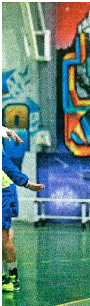
Filipe Anjoim / Global Images