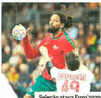
Seleção ataca Euro'2020

R Portugal não teve um sorteio nada fácil no que diz respeito aos grupos de qualificação para o Europeu de 2020, organizado pela Suécia, Áustria e Noruega. A Seleção vai disputar o Grupo 6, tendo como adversários a fortíssima França (seis vezes campeã mundial, três europeia e duas vezes olímpica), Lituânia e Roménia, duas seleções com tradição na modalidade. Mesmo assim, Portugal parte como favorito ao apuramento, já que cada um dos oito grupos qualifica as duas primeiras equipas, numa prova que será alargada pela primeira vez a 24 conjuntos: os três países anfitriões e a Espanha, campeã em título, têm entrada direta. Os quatro melhores terceiros classificados também serão repescados para a fase final. ● A.R.