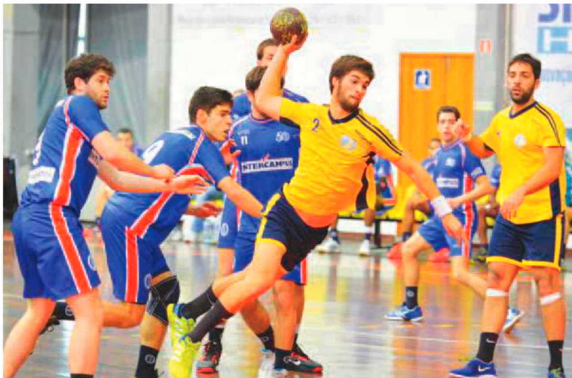
Madeira Andebol SAD bateu o Passos Manuel no Funchal.