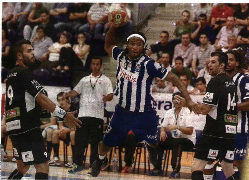
Esta noite FC Porto procura liderança isolada e Águas Santas pode igualar ABC

permitiu aos maiatos seguir em frente na Europa, referiu: "Não somos favoritos, mas estamos numa fase boa e vamos tentar disputar o jogo ao máximo. Se pudermos repetir a vitória que nos encheu de orgulho será excecional. O FC Porto está sempre bem preparado, é uma equipa fortíssima. Esperemos que o cansaço não se reflita no jogo". ■