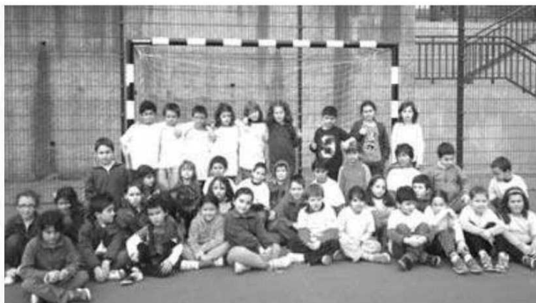
Meia centena de alunos aliaram-se à modalidade de andebol.