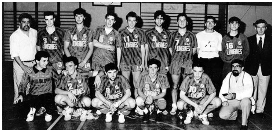
Equipa masculina do Clube de Andebol de Caminha

Ainda nos primeiros anos de existência, o clube começa a organizar um torneio internacional masculino, no qual participavam as melhores equipas nacionais e algumas das melhores equipas internacionais.