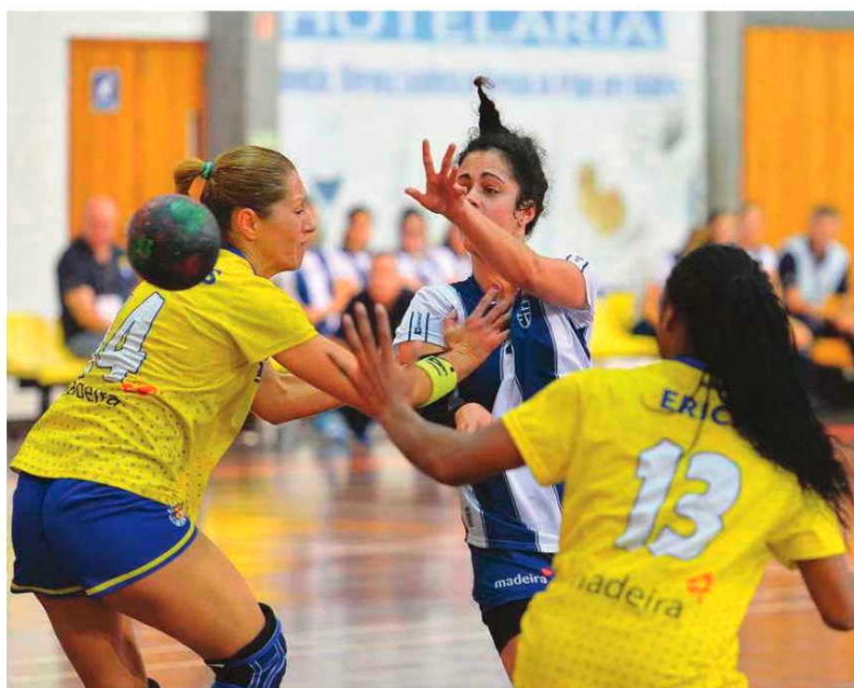
Equipas madeirenses já trabalham para a nova temporada.