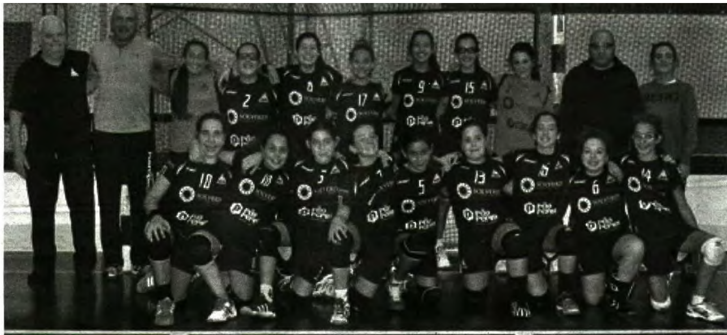
As infantis (con)venceram a equipa "A" do Feirense por 37-13