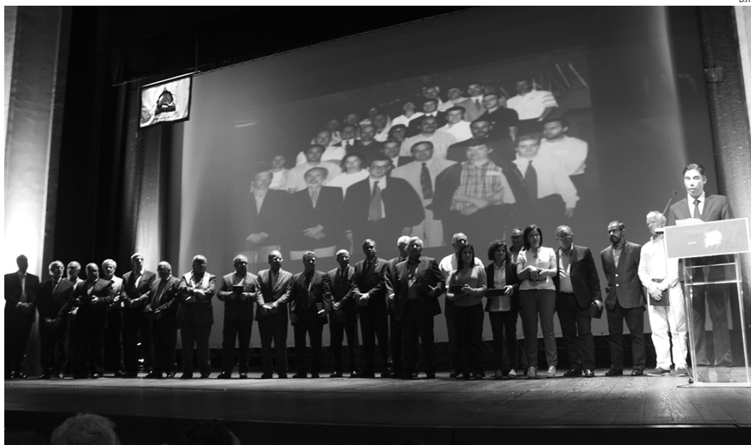
Fundadores do Alavarium - Andebol Clube de Aveiro subiram ao palco do Teatro Aveirense para uma justa homenagem