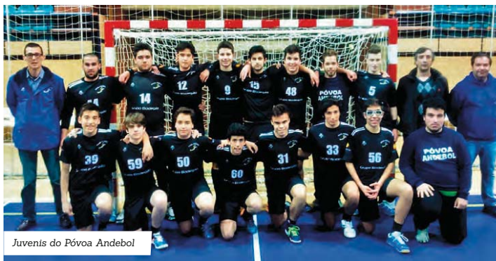
Juvenis do Póvoa Andebol

Fora do pavilhão, a equipa de minis, que se sagrou campeã regional, vai no próximo sábado à tarde ser homenageada. A sessão está marcada para as 16h, no Diana Bar.