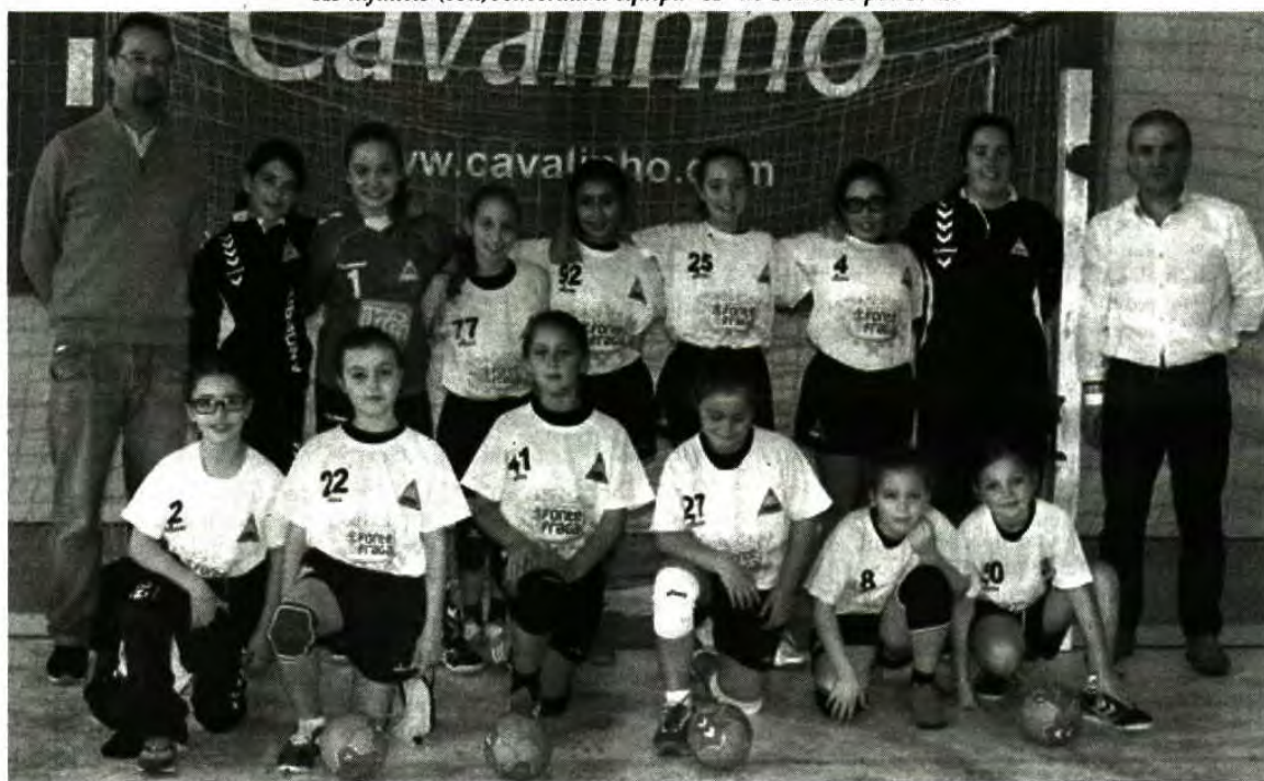
As minis venceram o Valongo do Vouga por 19-10

jogo das minis, foi a vez da equipa "A" de infantis do Feirense regressar a terras da feira, com uma pesada derrota, desta feita por 37-13. Com este resultado a uma jornada do fim do Campeonato Regional, a equipa de infantis está