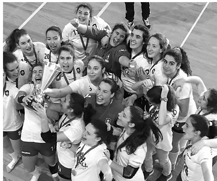
Juvenis do Colégio de Gaia sagraram-se campeãs nacionais e festejaram efusivamente