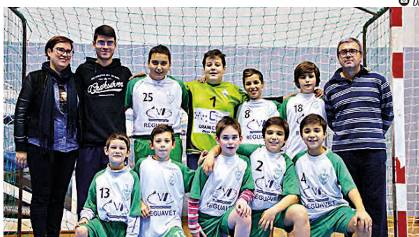
● AD GODIM – MINIS BAMBIS

A Federação Portuguesa de Andebol visita a cidade do Peso da Régua num primeiro encontro com a Associação Desportiva de Godim e a Câmara Municipal para a entrega da realização do maior evento que irá decorrer na cidade reguense, o Encontro Nacional de Minis, de 29 de junho a 3 de julho.