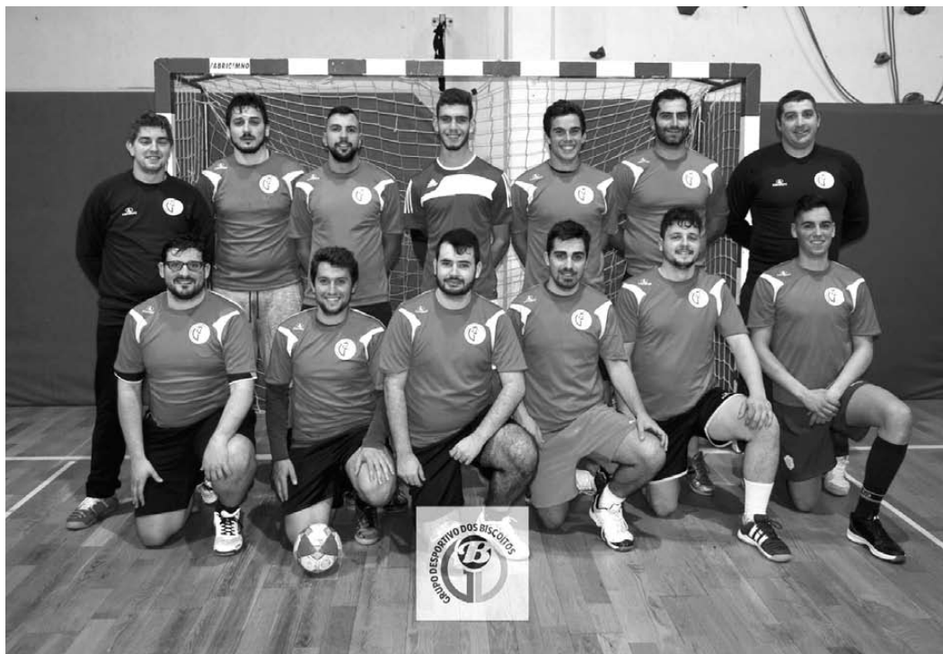
GD BISCOITOS acredita que pode chegar ao título regional de andebol

GD Biscoitos, Marítimo SC, GDGP Arrifes e CD São Pedro disputam, entre hoje e domingo, em Ponta Delgada, o Campeonato Regional de Andebol, seniores.