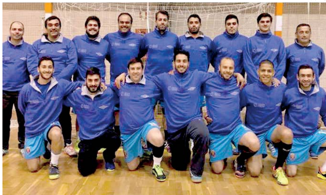
Andebol do Marítimo luta pelo título regional neste fim-de-semana