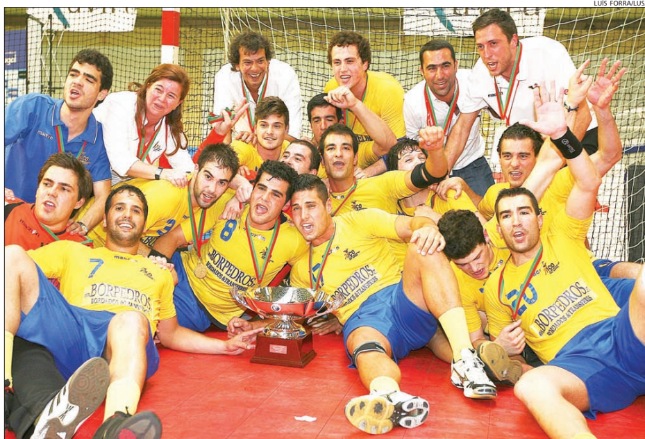
Atletas do Xico exultam com a conquista da Taça de Portugal

Com uma vantagem de apenas três golos ao intervalo, o Xico entrou para a segunda