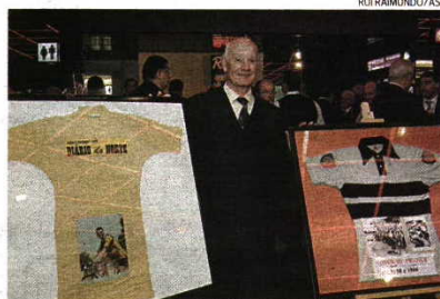
... tal como Alves Barbosa, que enriqueceu a história do ciclismo...