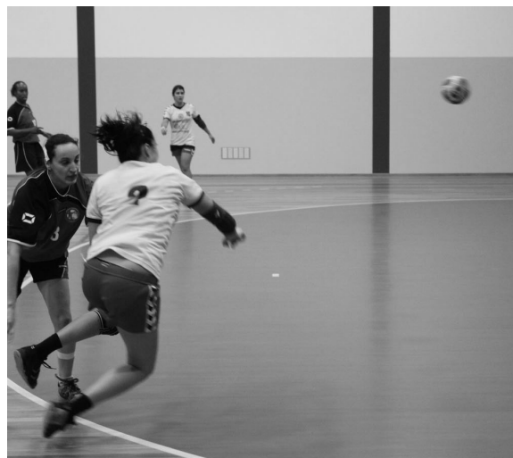
AO INTERVALO já era bem visível a diferença entre as duas equipas

Com este resultado, a Juve Lis encontra-se no segundo lugar, com 24 pontos, a três pontos da Madeira SAD. |