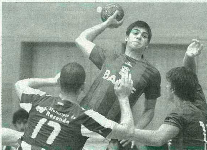
Marítimo perdeu em casa com o Porto

Na próxima jornada o Marítimo defronta o Espinho. H.D.P.