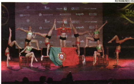
Uma demonstração de ginástica foi outro dos momentos altos da noite de Prémios da COP

também fez e continua a fazer como ninguém. «Estou habituada a entregar prémios, pois deixei de competir há mais de 20 anos, mas é bom recebê-los. Gostei dos aplausos dos jovens que nunca me viram correr.»