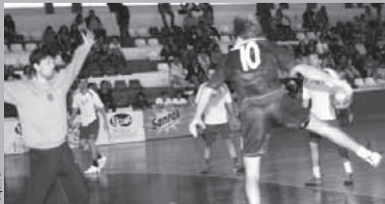
A equipa 'verde e branca' quer continuar nos lugares cimeiros da tabela

Depois do concludente triunfo por 34-25 sobre o Passos Manuel a contar para a 3.ª Eliminatória da Taça de Portugal, a equipa sénior de andebol do Vitória Futebol Clube recebe este sábado no pavilhão Antoine Velge, a partir das 18 horas, o conjunto do Alto do moinho, em partida referente à 7.ª Jornada da 1.ª Fase Zona Sul. Recorde-se que no encontro com o Passos Manuel, os atletas