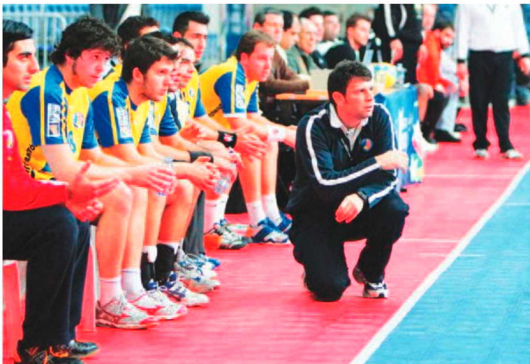
Madeira SAD volta a defrontar esta tarde o ABC, no Funchal.

No caso dos três pontos ficarem na Região, o Madeira Andebol SAD praticamente poderá consolidar o seu primeiro objectivo em termos classificativos, que passa pelo obtenção de um lugar europeu, dentro dos quatro primeiros classificados, pese embora a equipa, reconheça-se, tenha todas as condições para subir ainda mais na tabela classificativa como já o provou.