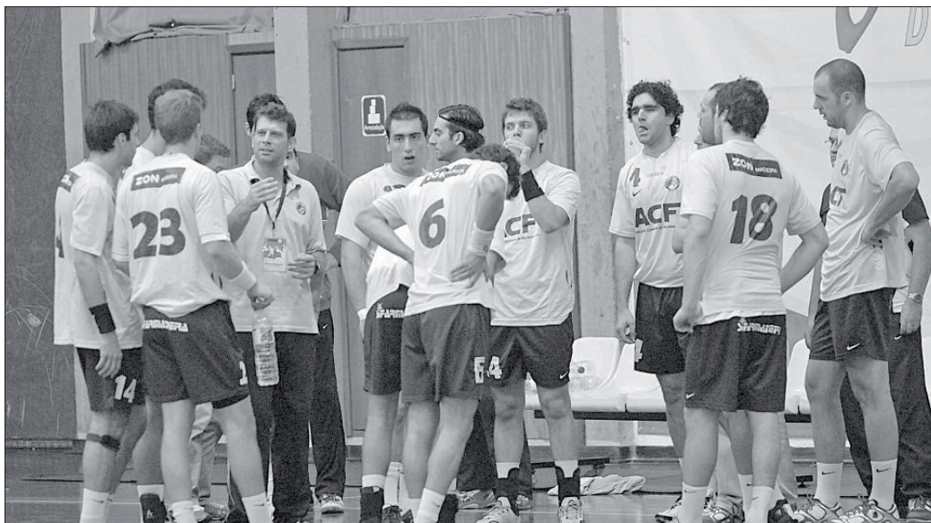
Um triunfo na recepção ao ABC mantém o Madeira SAD no topo da classificação da I divisão masculina de andebol.