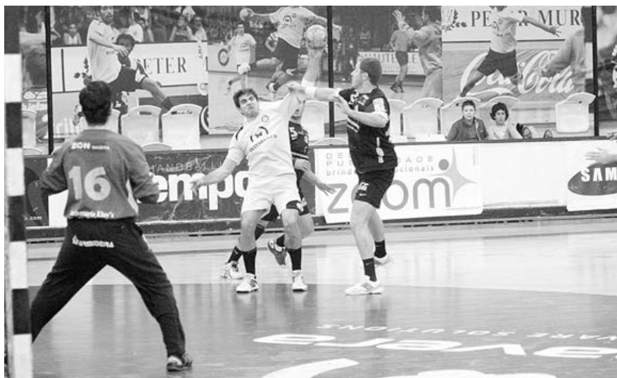
ABC pontuou na deslocação ao Funchal

O ABC reagiu, fez um parcial de 4-0 e 'encostou-se' ao adversário à passagem do minuto 50 (16-15). As duas equipas entraram empatadas nos cinco