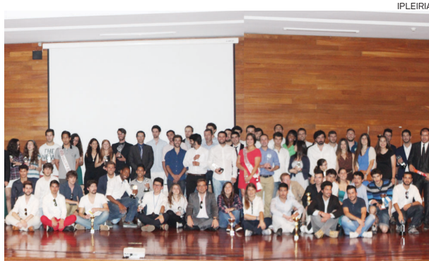
Esta iniciativa decorreu pelo 12.º ano consecutivo