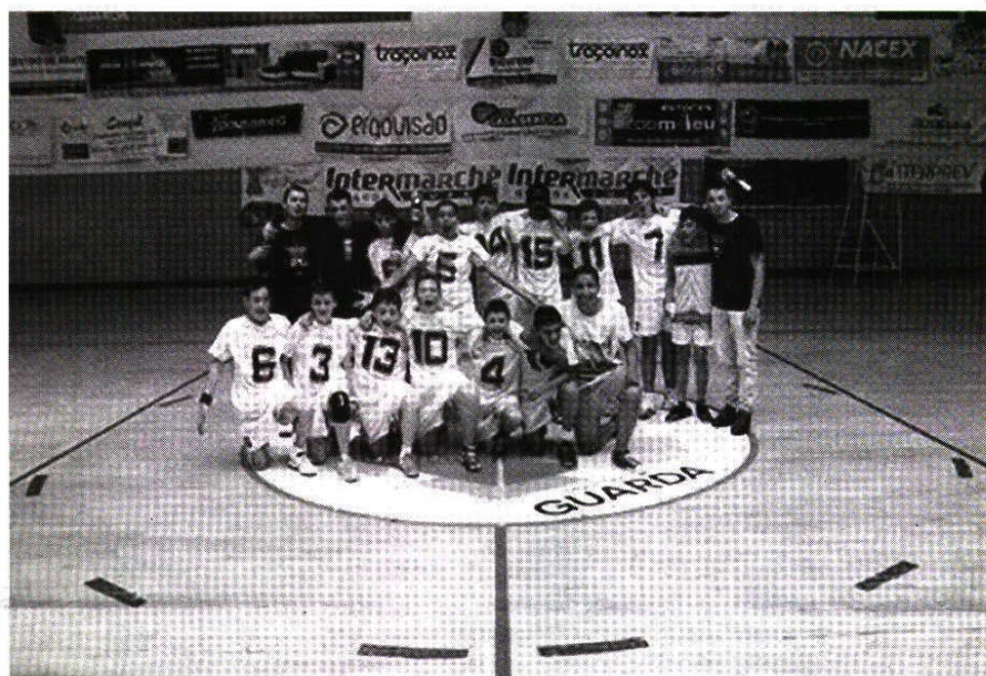
Os infantis do IPG sagraram-se campeões regionais de Andebol