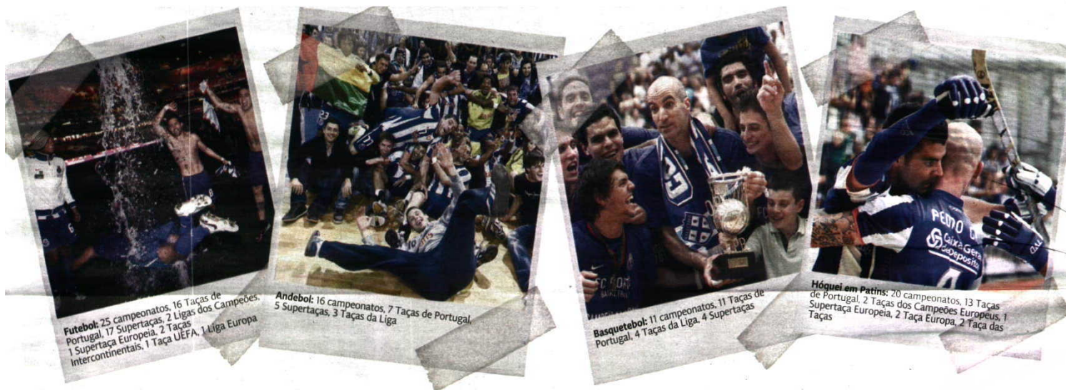
Futebol: 25 campeonatos, 16 Taças de Portugal, 17 Supertaças, 2 Ligas dos Campeões, 1 Supertaça Europeia, 2 Taças Intercontinentais, 1 Taça UEFA, 1 Liga Europa