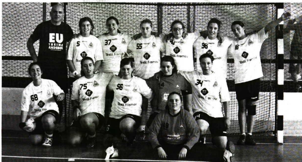
A equipa de iniciadas femininas