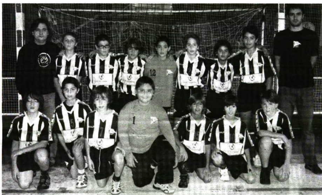
A equipa de infantis do Sporting Clube de Espinho estreou-se com uma vitória em S. João da Madeira

Entretanto, salienta-se a vitória dos mais pequeninos (infantis) no primeiro encontro do Campeonato Nacional realizado na terça-feira (feriado). Os tigres bateram a Sanjoanense (uma equipa mais forte e mais experiente),