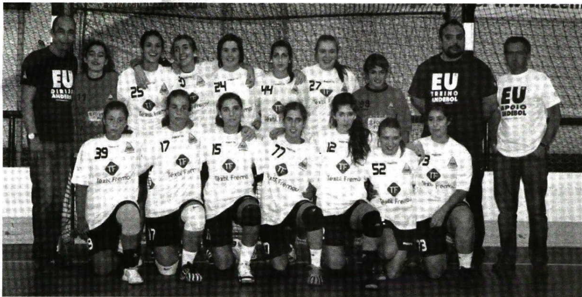
As juniores serão a retaguarda da equipa de seniores