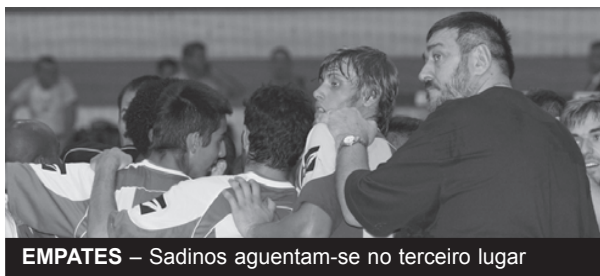
EMPATES – Sadinos aguentam-se no terceiro lugar

Esta marca deixa o «sete» liderado por Konstantin Dolgov ainda na zona de apuramento na Zona Sul do «nacional» secundário, a um ponto do segundo classificado, o CDE Camões, e com igual margem de distância do quarto, o Alto do Moinho, equipa que recebe na próxima ronda.