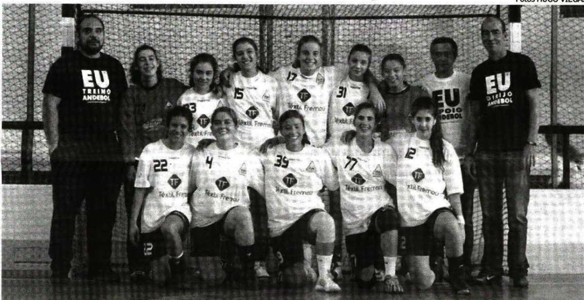
A equipa de juvenis femininos terá grandes ambições no Campeonato Nacional da 1 Divisão

"Manter a dinâmica de crescimento e criar estruturas para num futuro próximo ter escalão sénior a competir no escalão máximo"