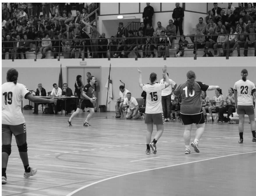
JUVE LIS foi sempre superior contra as inglesas num pavilhão cheio de entusiastas do andebol

Stopinu NHK da Letónia, numa eliminatória a duas mãos cujos jogos se realizarão em 13/14 de Novembro na Letónia e 20/21 do mesmo mês em Portugal.