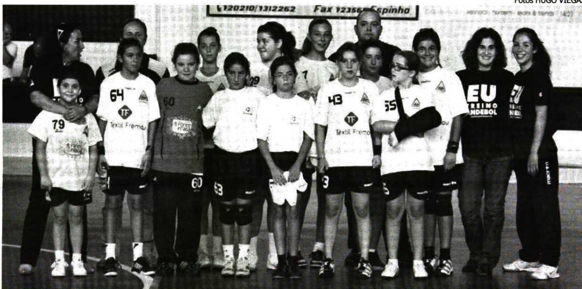
A equipa de infantis femininas