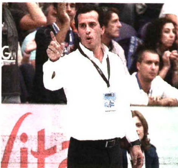
ADEUS. Último jogo foi domingo no Dragão Caixa

O bracarense teve um currículo impressionante enquanto jogador, ao ganhar 5 títulos pelo ABC e 1 pelo Sporting, para além de se sagrar vice-