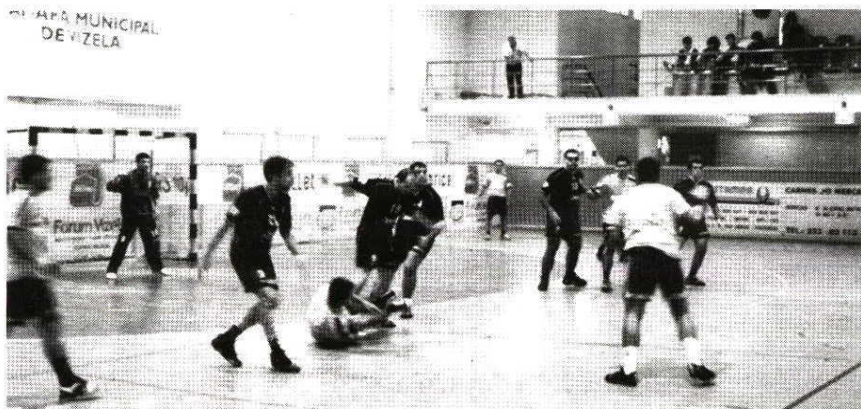
Vizelenses com vitórias em competições diferentes