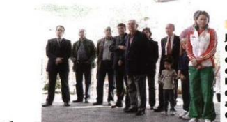
Mestre ao lado da Missão 12, com alguns atletas e funcionários.

Neste sábado decorre um dia aberto a toda a família, com de-