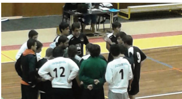
ATLETAS de Penedono a receber indicações do treinador

Na próxima jornada, o Ginásio Clube de Tarouca vai receber o Núcleo de Andebol de Pene-