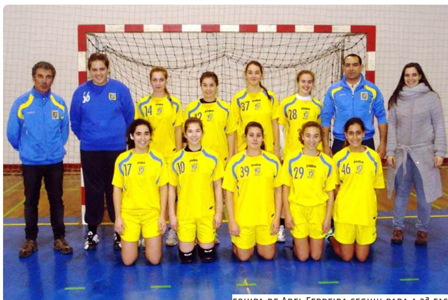
EQUIPA DE ABEL FERREIRA SEGUIU PARA A 2ª FASE

Na 1ª Divisão de juvenis masculinos, derrotas pesadas do Cister diante do São Bernardo (25-51) e do Dom Fuas frente ao Sismaria (24-41).