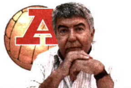
POR VÍTOR SERPA

Nos Estados Unidos há vinte anos que se chegou a uma conclusão incontornável: nem a televisão pode viver sem o desporto profissional nem este pode sobreviver sem televisão