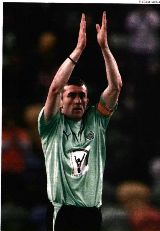
«Em Alvalade viu-se o que de melhor tem o desporto, seja profissional seja amador»