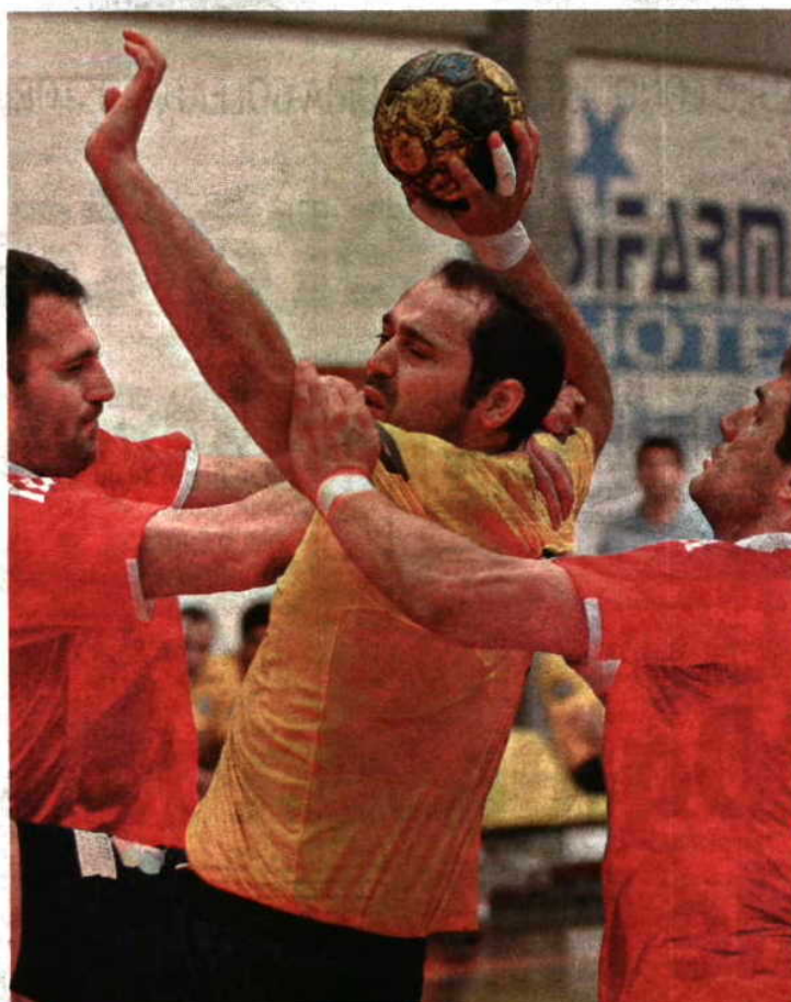
TRAVADOS. Insulares esbarraram na muralha defensiva benfiquista

Na segunda parte o jogo manteve a mesma toada, com o Benfica a lograr maior vantagem (15-10) à