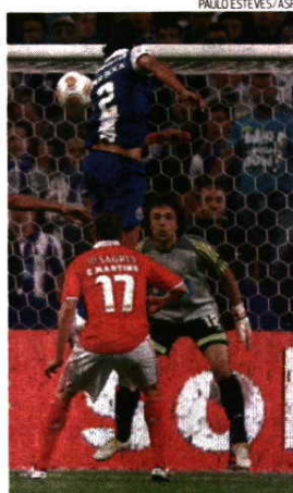
Futebol na TV gera grandes audiências

Julgo que há, em tudo isto, algum preconceito. A questão nunca poderá ser tão restrita e, por isso, nunca será se a RTP, televisão pública, deve, ou não, transmitir jogos de futebol. A questão é se a televisão pública, como chegou a ser aflorado, deve transmitir ópera e música clássica em horário nobre, coisa que nem a RTP2 faz, mantendo-se fora de todo o conceito comercial, responsabilizando, ainda mais, o erário público pela sua existência, ou se, pelo contrário, deve ter uma atitude con-