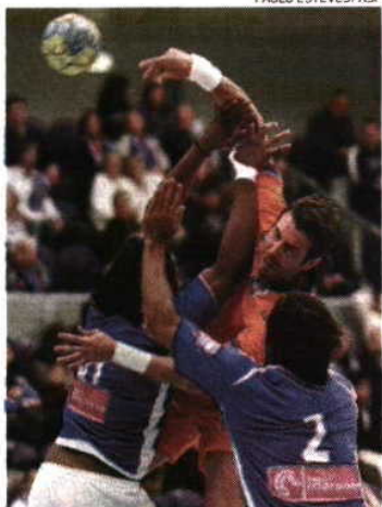
Semedo e Canela opõem-se a Spinola

O FC Porto está muito próximo de renovar o título nacional, encontrando-se a um triunfo do bicampeonato, o que pode acontecer já na próxima quarta-feira (19 horas), no Dragão Caixa, se bater o Madeira SAD. Quando faltam disputar quatro encontros para o final do Grupo A do Andebol 1, os dragões ultrapassaram o Belenenses, que vive momento de grande instabilidade.