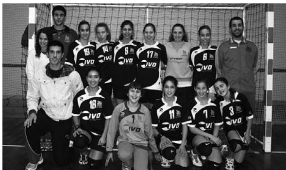
Equipa de Santa Catarina

No passado sábado a A.R.C.Catarinense recebeu e venceu a equipa de 3A-Associação Andebol Almeirim, num jogo bem disputado, onde a equipa da casa fez