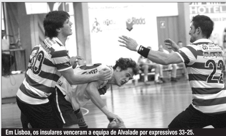
Em Lisboa, os insulares venceram a equipa de Alvalade por expressivos 33-25.