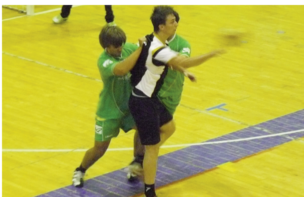
ACADÉMICO não ultrapassou "vidreiros" na última jornada

dente da última jornada foi, sem dúvida, a derrota da Académica em casa por uma diferença de 10 golos, contra o Batalha Andebol Clube, clube que com o triunfo entra também nas contas do apuramento para a fase que dá acesso à subida.