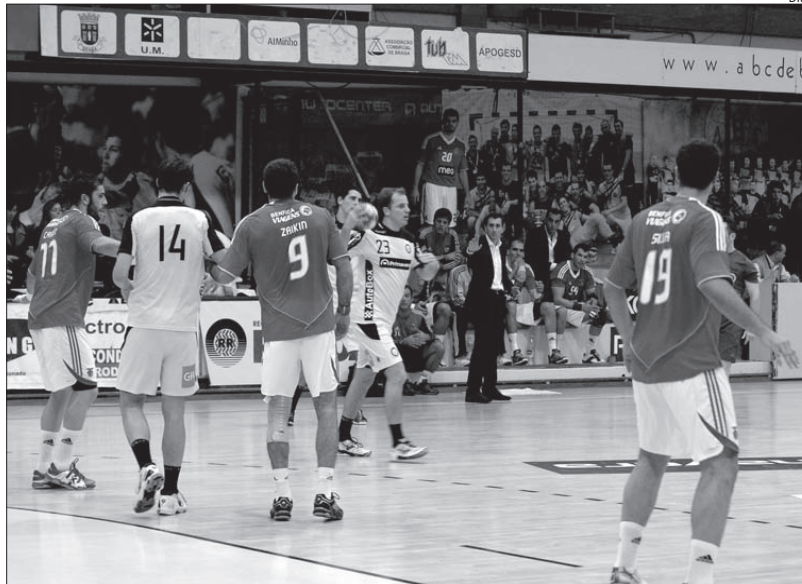
Benfica voltou a impor-se ao ABC, no Flávio Sá Leite

Nem duas semanas passaram desde a última visita do Benfica ao Pavilhão Flávio Sá Leite, então para a Taça de Portugal, e os encarnados voltaram a sair por cima no confronto com os minhos, agora para o campeonato. Ontem, na casa dos académicos, as águias souberam aproveitar os equívocos dos homens de Carlos Resende e acabaram por não facilitar nos momentos fulcrais, num encontro mal jogado e pouco emotivo para quem assistiu ao duelo.