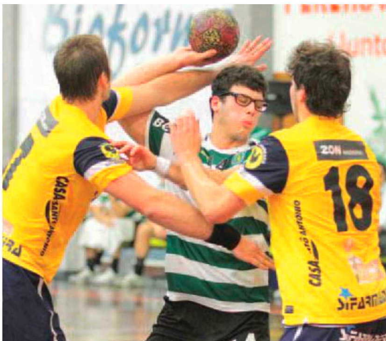
Madeira SAD mede forças com o actual terceiro classificado.

Esta jornada completa-se com a disputa dos jogos, ABC/Benfica, São Bernardo/Fafe, Belenenses/Águas Santas, Xico Andebol/Porto e Maia/Sporting da Horta.