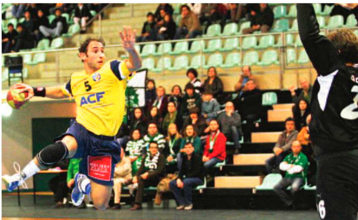
O Madeira SAD volta a surpreender desta vez frente ao Sporting.