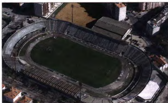
Estádio do Bonfim. Os candidatos pretendem recuperar os terrenos anexos para fazerem melhorias no recinto e apostar no ramo imobiliário

Advogado setubalense, de 56 anos, já esteve na SAD do Vitória, de onde saiu em 2012. Integró a equipa diretiva de Fernando Oliveira entre 2009/12.