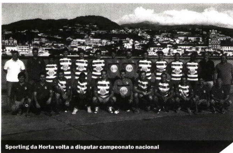
Sporting da Horta volta a disputar campeonato nacional

A uma semana de iniciar a sua época desportiva, o Sporting Club da Horta apresentou sexta-feira à noite a sua equipa principal que vai disputar o Campeonato Fidelidade Andebol 1.