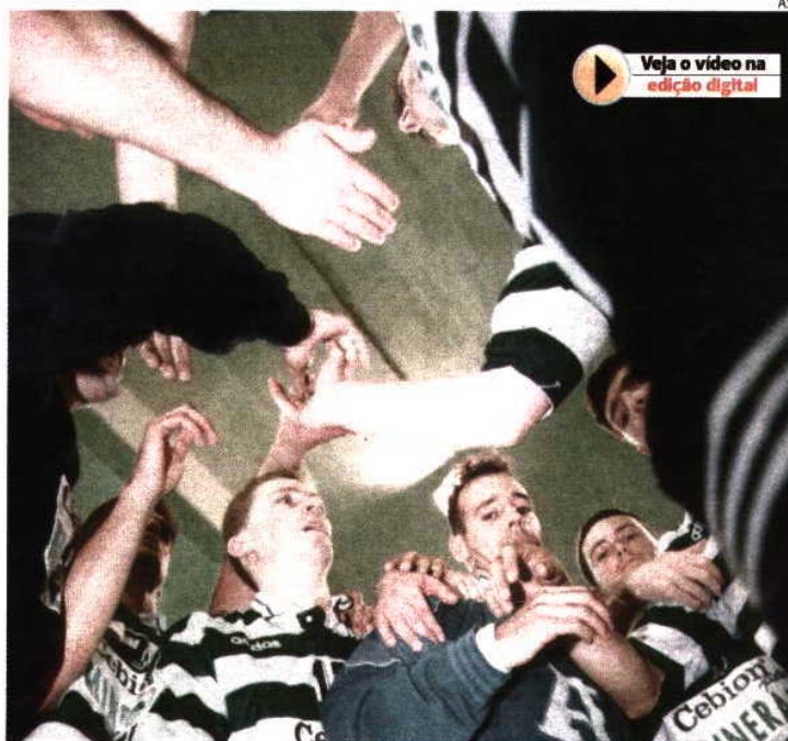
Sporting defrontou em 1996 o Montpellier, adversário que deixou recordações amargas

Mais de 17 anos depois, o Montpellier volta a surgir no caminho do Sporting e o treinador Frederico Santos reconheceu: «O Montpellier tem muitos pontos fortes. É uma equipa formada por excelentes jogadores, a começar na