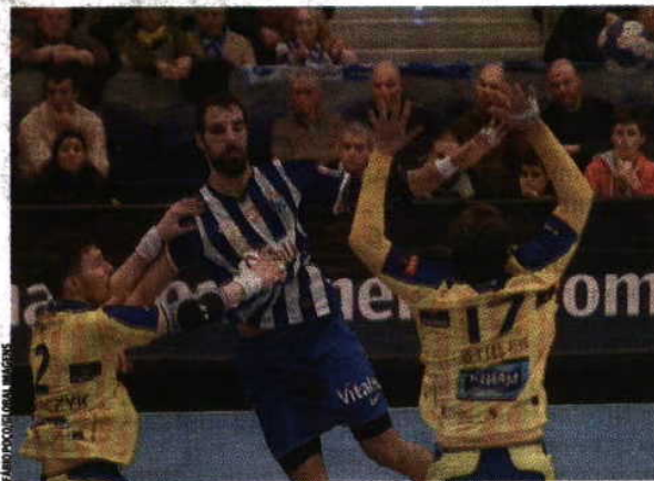
Força João Ferraz não teme os franceses e quer vencer

Queremos ganhar e, se o conseguirmos, não ficamos em último. Sabíamos que podíamos ter feito mais, mas não foi fácil, principalmente no último jogo, em que nos batemos com uma grande equipa. A nível geral, batemo-nos bem e agora queremos a terceira vitória." Os dragões despedem-se da Europa no dia 19, com a deslocação à Alemanha, onde medem forças com o Kiel. A formação portuguesa tem quatro pontos, graças a vitórias caseiras frente a Dunquerque e Kolding.