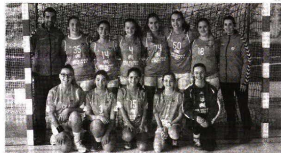
Iniciadas Femininas da AEDR perderam em casa com o Cister SA

No Torneio de Outono em Infantis Masculinos, em partida atrasada da 2ª jornada, o Externato Dom Fuas Roupinho empatou fora com o NDA Pombal (19-19).