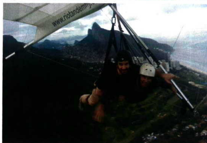
Campeões No dia da prova de canoagem, com os medalhados olímpicos Fernando Pimenta e Emanuel Silva. Em baixo, voando sobre o Rio de Janeiro e junto à Ópera de Sydney