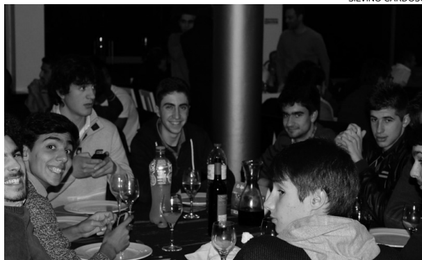
Atletas jovens do clube marcaram presença na Ceia de Natal