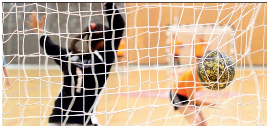
UM tem alcançado resultados de excelência na prática desportiva

Em 2013, a instituição minhota já tinha sido distinguida com o primeiro lugar, após ter alcançado três pódios consecutivos nos anos anteriores.