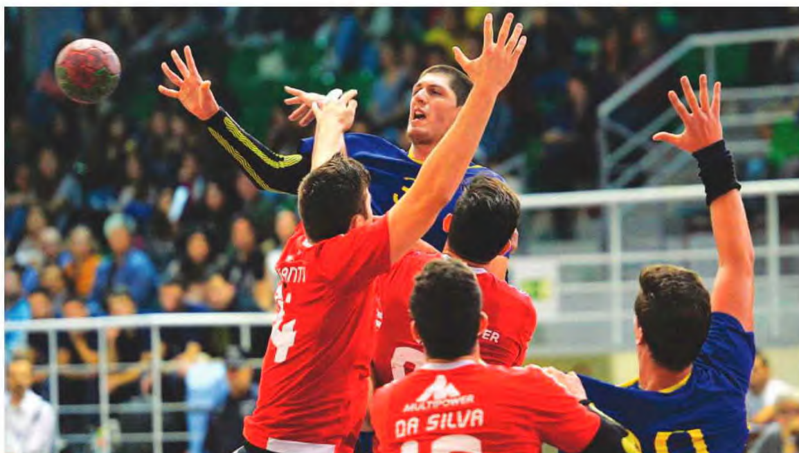
Madeira SAD e Benfica deram espectáculo no Funchal.

HERBERTO D. PEREIRA desporto@dnoticias.pt