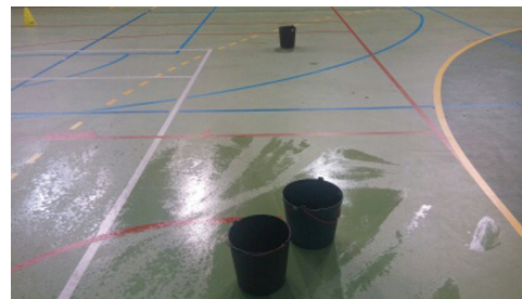
As infiltrações de água verificam-se em várias zonas do campo desportivo.

O Pavilhão Desportivo de Oliveira de Frades foi inaugurado no ano passado, em Março, e tem cerca de