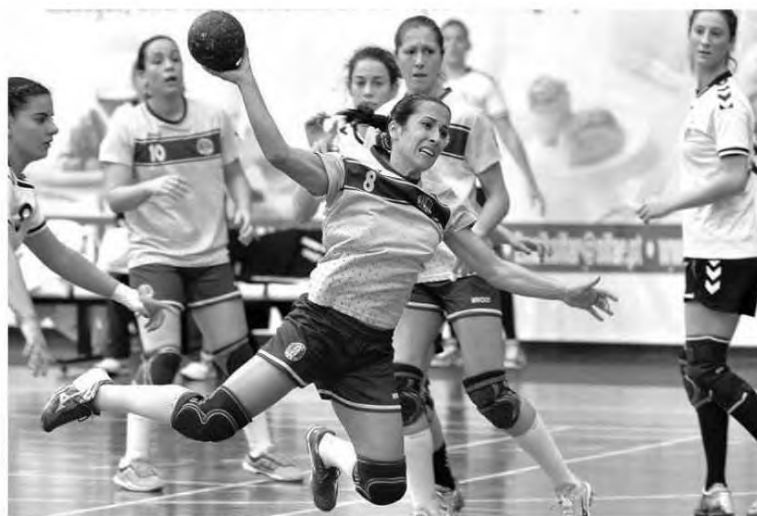
Madeira Andebol e Sports em destaque.