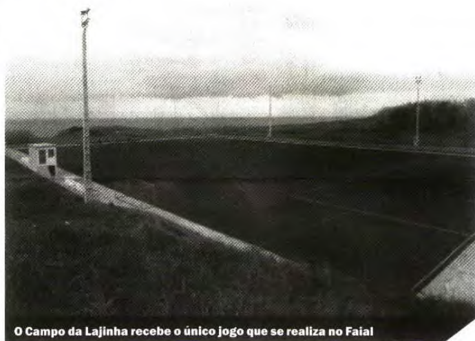
O Campo da Lajinha recebe o único jogo que se realiza no Faial

A contar para a terceira jornada do Torneio Antero Gonçalves, os seniores masculinos do AV Capelo de frente com os seniores do Flamengos, jogo