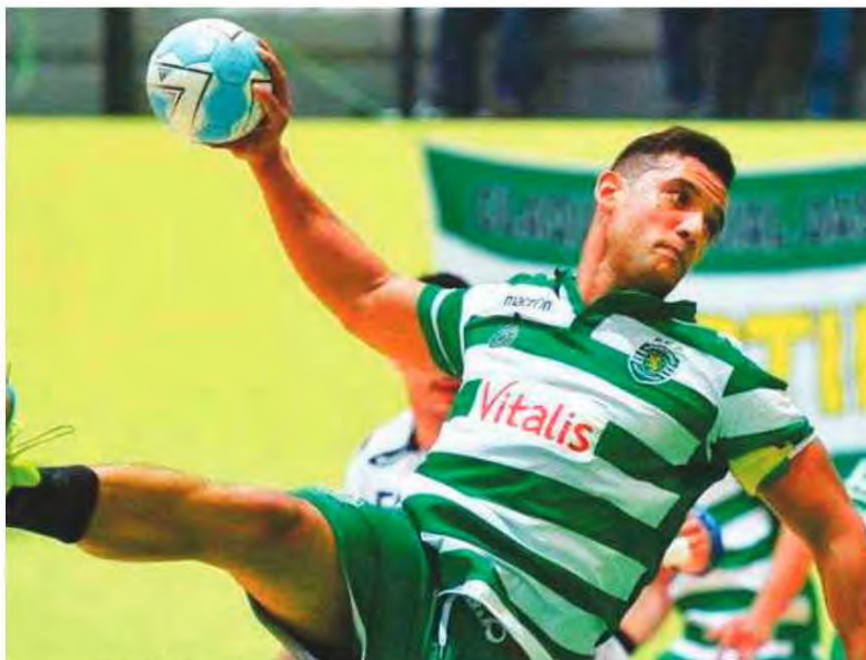
Ex-capitão do Sporting vai vestir a camisola do Madeira SAD