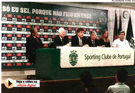
Bruno de Carvalho quer futebol moderno e transparente

continuar, ficarei satisfeito porque não preciso, nem para o Sporting, nem para a vida pessoal, de favores», garantiu o presidente dos leões e logo completou sobre a entrevista: «Mas, garantidamente, o que percebi é que tenho de dar graças a Deus a toda a gente e a todo o Mundo porque somos um clube que passou a ser abençoado com a ajuda de todos. Isso é sempre bom. Mas o que retive foi um serão bem passado, bem-disposto e sempre que for assim fico contente e satisfeito.»