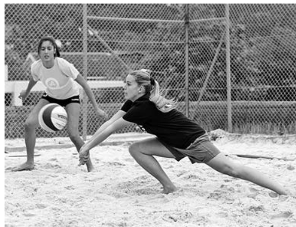
Voleibol de praia centra as atenções no Troféu Reitor

Nesta última jornada a competição determinou que se encontrassem Gestão e LEI. A partida terminou com a vitória esmagadora de LEI por 11-30. Na próxima jornada, o futsal masculino decidirá as últimas equipas que passam aos oitavos de final.