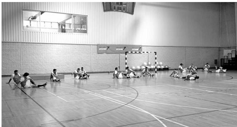
Seleção nacional universitária em treino no Pavilhão da UMinho

Na cidade-berço, o Campeonato Mundial Universitário de Andebol 2014 terá como palcos os pavilhões Multiusos, Almor Vaz