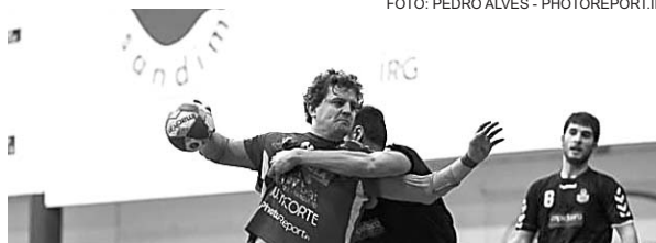
Vitória moralizou a equipa do Modicus