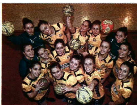
JOSE CARMO / GLOBAL IMAGENS