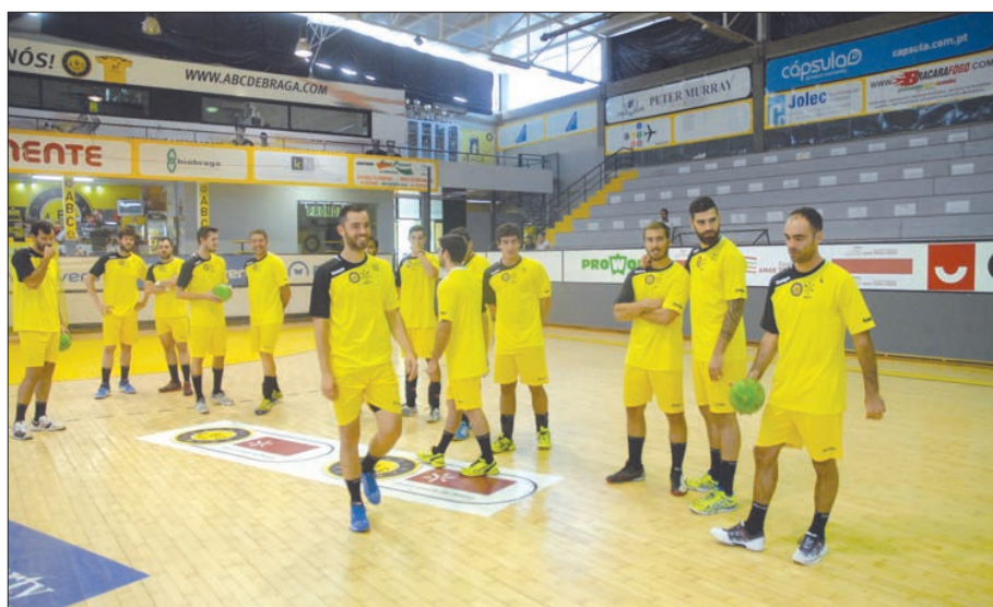
ABC joga passagem aos quartos de final com adversário esloveno

é constituído esmagadoramente por jogadores estónios, tendo dois jogadores ucranianos.